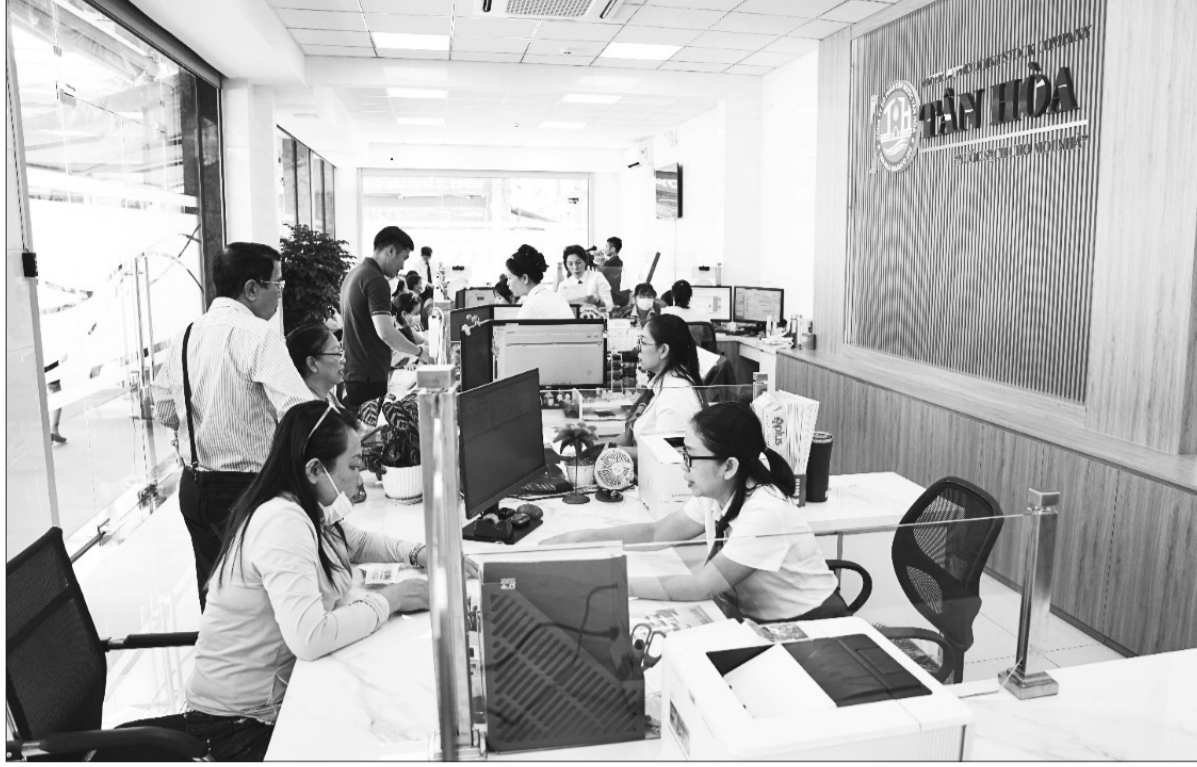
Ngoài giao dịch trực tiếp, ứng dụng chăm sóc khách hàng giúp Công ty cổ phần Cấp nước Tân Hòa hỗ trợ khách hàng nhanh chóng, hiệu quả.