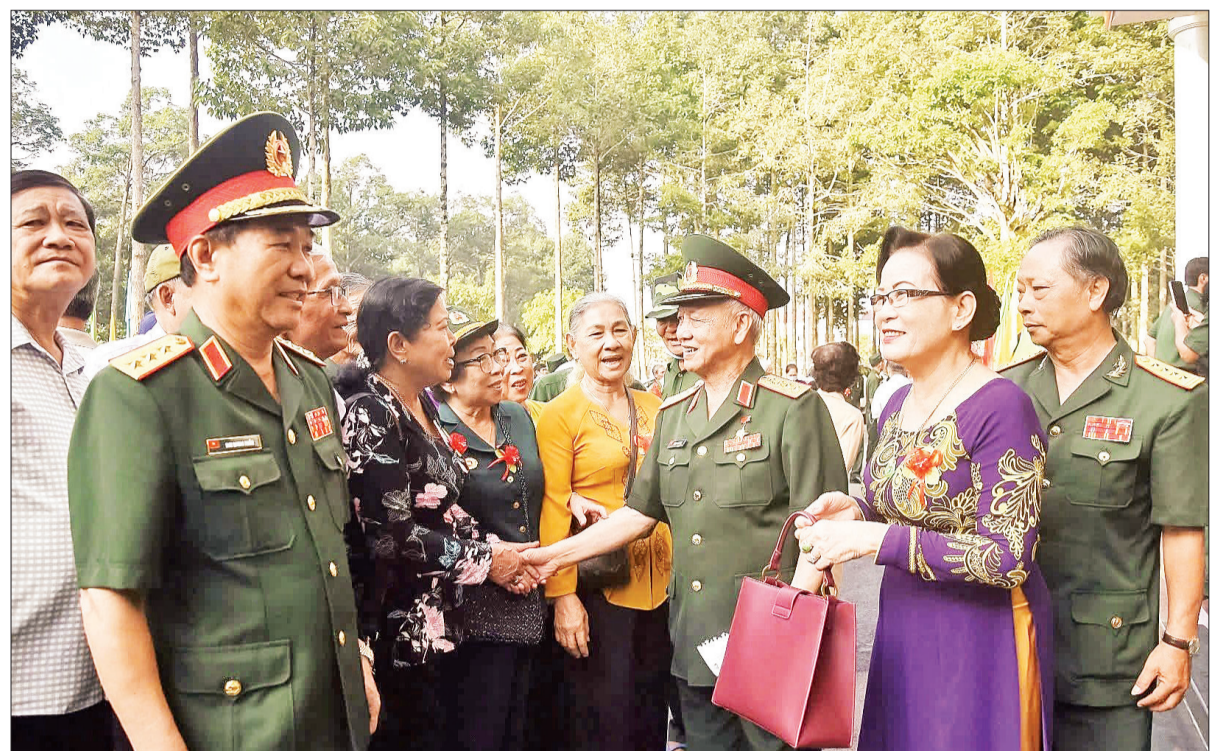
Đại tướng Phạm Văn Trà (người thứ ba từ phải sang), nguyên Ủy viên Bộ Chính trị, nguyên Bộ trưởng Quốc phòng gặp gỡ các cựu chiến binh tại Quân khu 9.

thành lập ngày 1/7/1949 tại xóm Gò Pháo, xã Tân Cương, huyện Đông Hy, tỉnh Thái Nguyên (nay là xã Tân Cương, thành phố Thái Nguyên). Tham gia Chiến dịch Biên giới năm 1950, các đơn vị của trung đoàn tiêu diệt và bắt khoảng 8.000 tên địch, thu 3.000 tấn vũ khí và phương tiện chiến tranh, giải phóng vùng biên giới từ huyện Đình Lập (Lạng Sơn) cho tới Cao Bằng. Với những trận đánh nổi tiếng ở đội Cốc Phông, núi Trọc Ngà, điểm cao 477, trung đoàn đã được Nhà nước tặng thưởng Huân chương Quân công hạng nhất; vinh dự được Bác Hồ đến thăm đơn vị tại chân đèo Lũng Phầy.