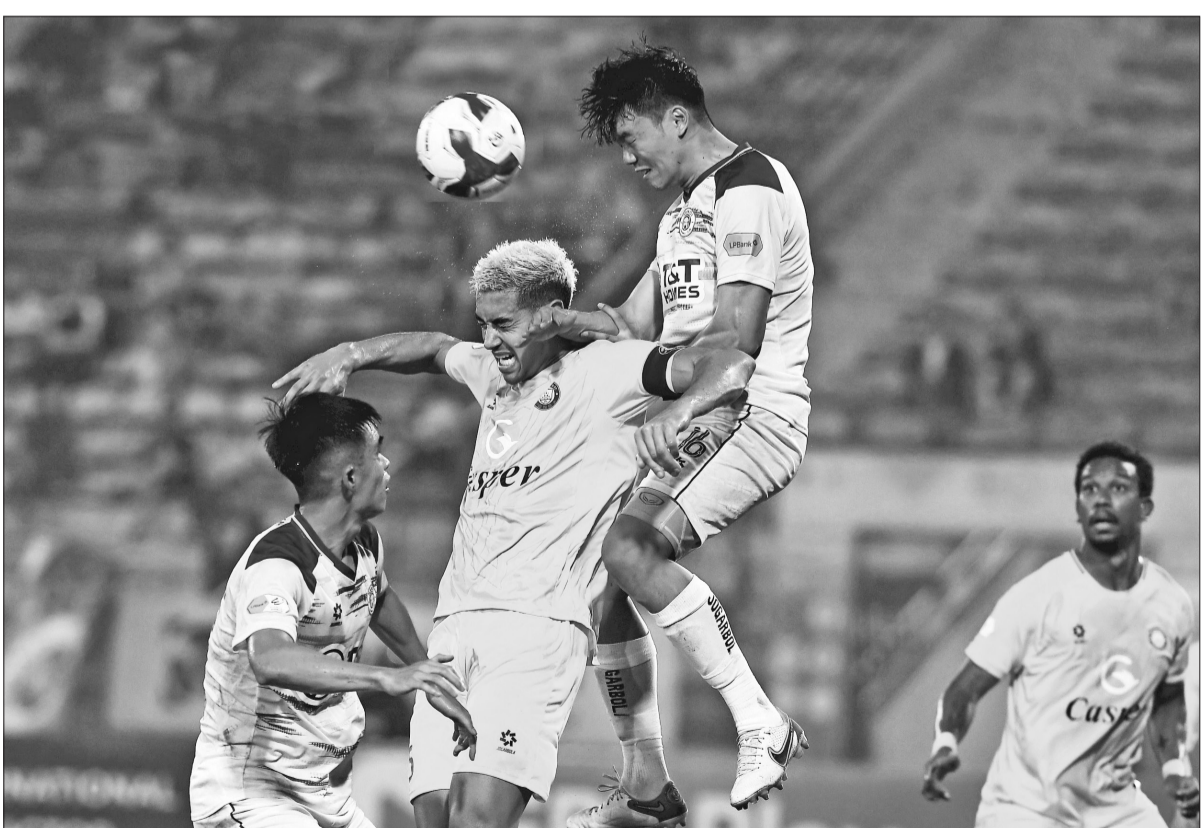
Pha tranh bóng giữa cầu thủ hai đội Hà Nội FC và Đông Á Thanh Hóa.