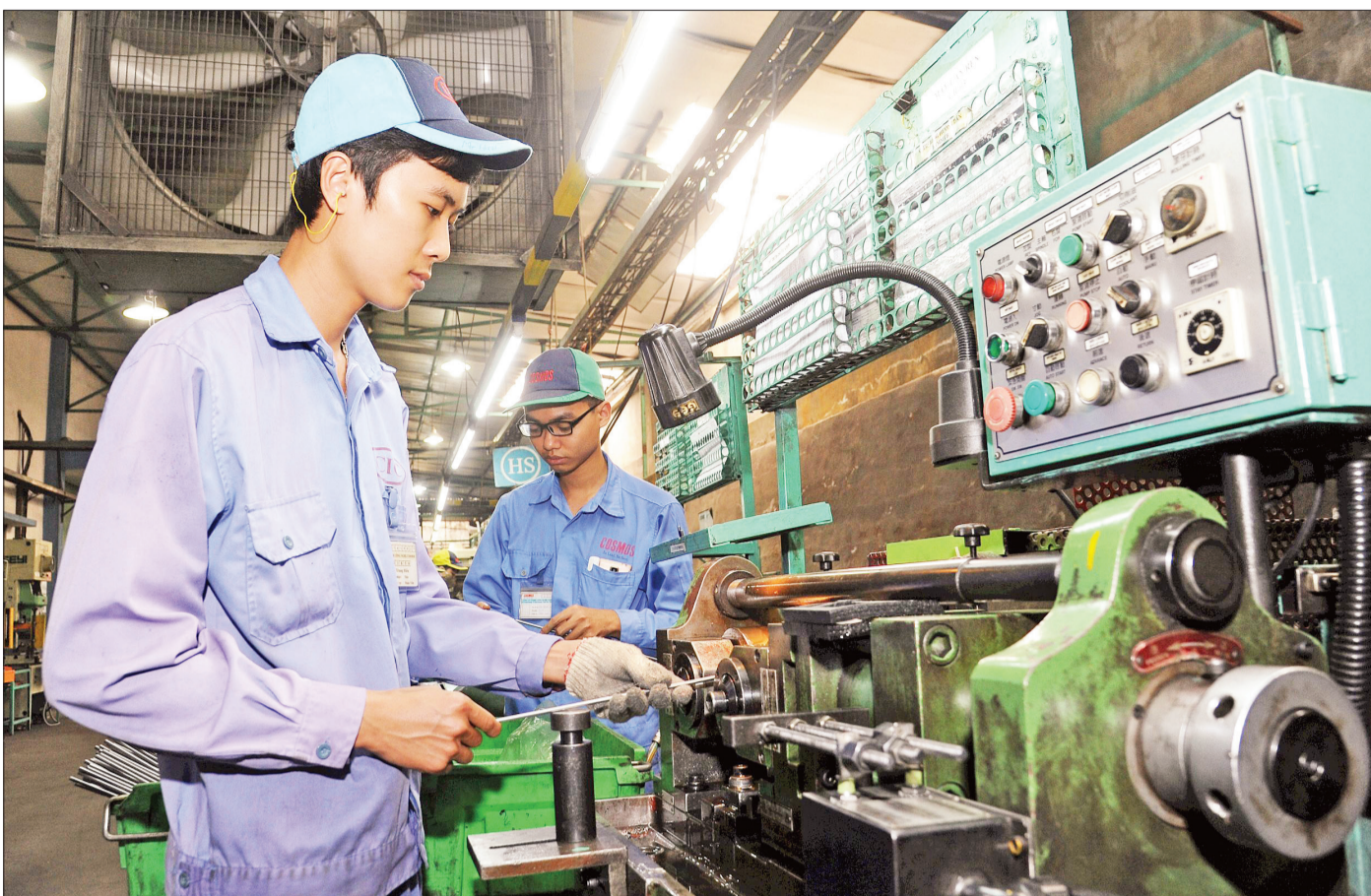
Sản xuất linh kiện xe máy tại Công ty TNHH Công nghệ Cosmos (Khu công nghiệp Khai Quang, Vinh Phúc).