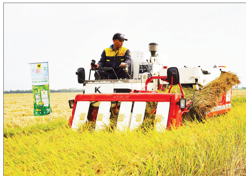
Máy eo giới trình diễn thu hoạch lúa chất lượng cao, phát thải thấp.

Người dân và các hợp tác xã tham gia đề án “Phát triển bền vững một triệu héc-ta chuyên canh lúa chất lượng cao và phát thải thấp gắn với tăng trưởng xanh vùng Đồng bằng sông Cửu Long đến năm 2030” (gọi tắt Đề án một triệu héc-ta) theo Quyết định số 1490/QĐ-TTg ngày 27/11/2023 bước đầu thu được kết quả tích cực. Qua đó, khẳng định trồng lúa chất lượng cao và phát thải thấp gắn với tăng trưởng xanh là xu thế tất yếu, mang về lợi nhuận và tình bền vững.