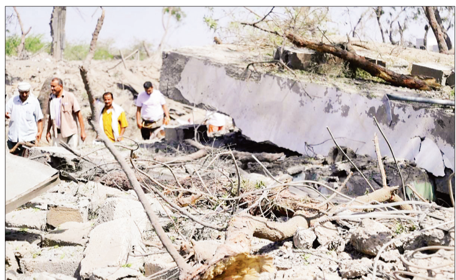
Hiện trường một vụ không kích xảy ra trên lãnh thổ Yemen.

Mỹ tiếp tục tiến hành các cuộc không kích nhằm vào lực lượng Houthi ở Yemen sau khi Tổng thống Donald Trump tuyên bố chiến dịch không kích Houthi sẽ kéo dài đến khi nhóm này ngừng tấn công tàu thuyền trên Biển Đỏ. Tuy nhiên, bất chấp nỗ lực tập kích của Mỹ, Houthi tiếp tục phóng tên lửa và máy bay không người lái vào các mục tiêu ở vùng biển này. Các nhân viên y tế Liban cho biết, ít nhất một người đã thiệt mạng và bốn người bị thương khi lực lượng Mỹ không kích một cửa hàng và một ngôi nhà ở thành phố Saada, miền bắc Yemen tối 5/4. Trong diễn biến liên quan cùng ngày, lực lượng Houthi bác bỏ tuyên bố của Washington rằng, Mỹ đã không kích nhằm vào một cuộc họp