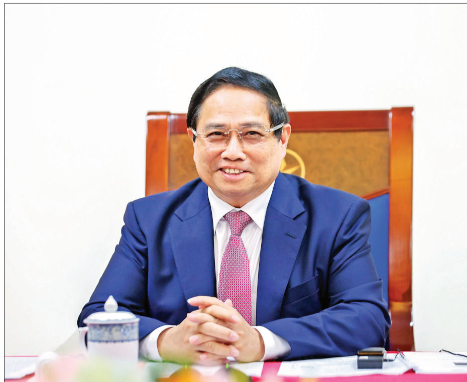
Thủ tướng Phạm Minh Chính điện đàm với Thủ tướng Malaysia Anwar Ibrahim.

Chiều 6/4, theo đề nghị của phía Malaysia, Thủ tướng Chính phủ Phạm Minh Chính điện đàm với Thủ tướng Malaysia Anwar Ibrahim để trao đổi về tình hình quan hệ song phương và đánh giá về một số vấn đề khu vực, quốc tế mới nổi gần đây.