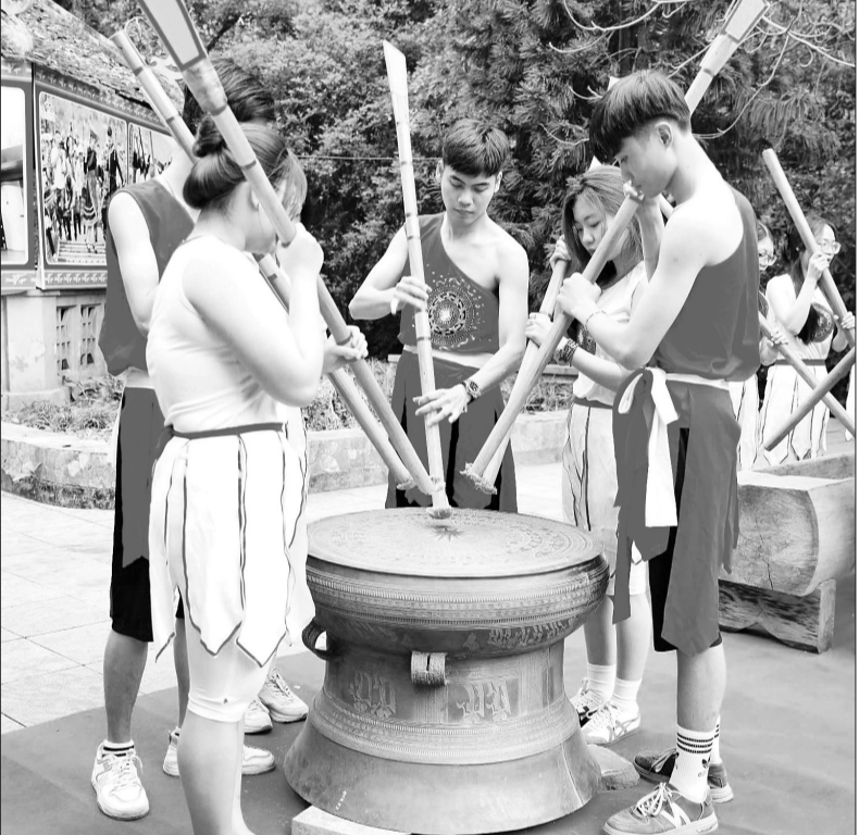
Trò chơi đánh trống đồng, đám đường thu hút đông đảo du khách.

Du ai đi ngược về xuôi/ Nhớ ngày giỗ Tổ mừng mưng tháng ba. Câu ca ấy bao đời nay đã ăn sâu vào tiềm thức mỗi người dân đất Việt. Dù ở bất cứ nơi đâu, cứ đến ngày Giỗ Tổ, con dân đất Việt trên mọi miền Tổ quốc, kiều bào ta ở nước ngoài đều hướng về đền Hùng (Phủ Thọ), một lòng thành kính tri ân công đức tổ tiên.