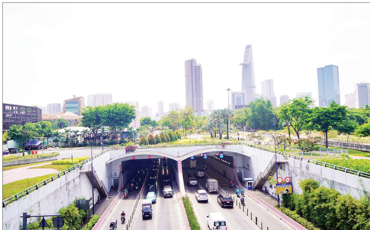
Hầm Thủ Thiêm.

cần hóa giải chính là cơ chế "đổi đất lấy công trình" giữa thành phố và nhà đầu tư cuối cùng đã được thống nhất.