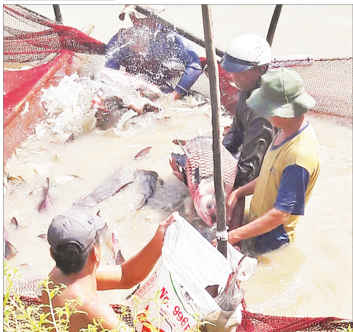
Nuôi cá hô thương phẩm ở tỉnh An Giang.

gần một lượng vàng. Một mùa cá hô bắt được vài con xem như trúng mánh.