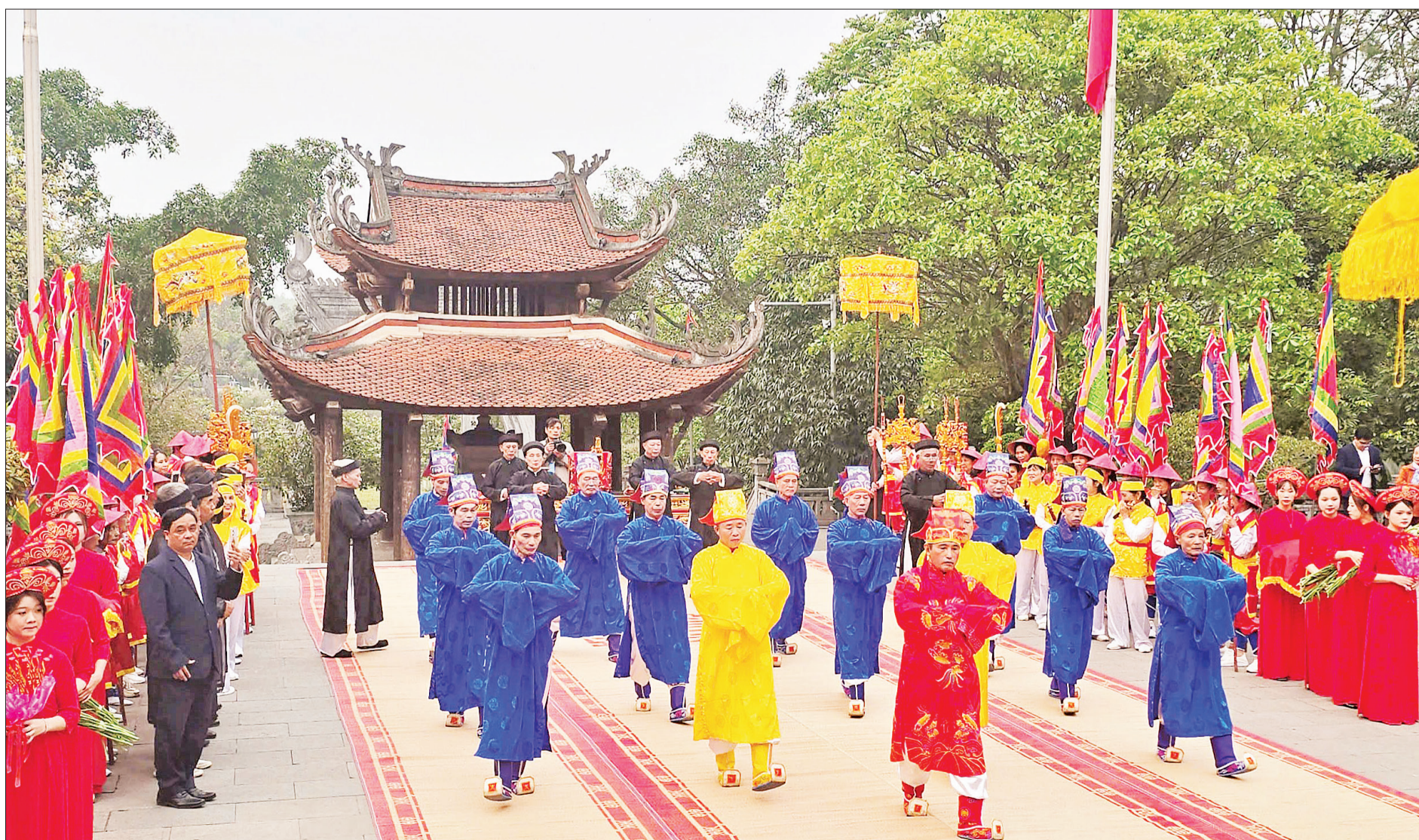
Thực hiện nghi thức Tế lễ truyền thống tại đền Quốc Tổ Lạc Long Quân.