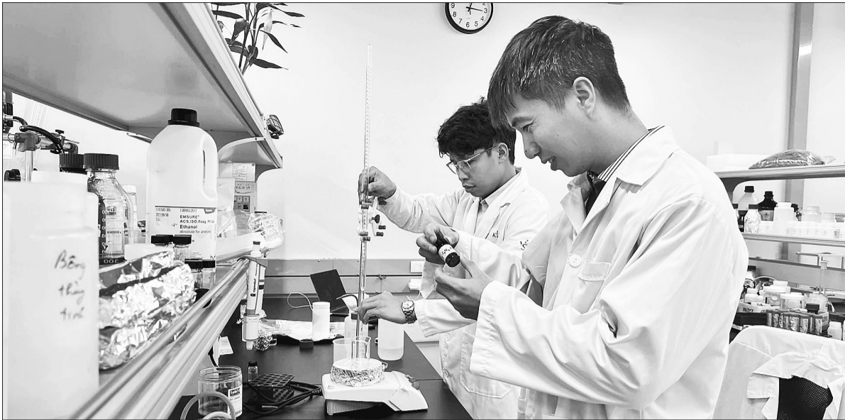
Hoạt động nghiên cứu khoa học tại Viện Khoa học và Công nghệ Việt Nam-Hàn Quốc.