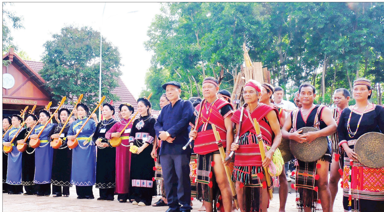
Sắc màu các dân tộc anh em tại huyện Bù Đăng tham dự lễ hội "Vang mãi tiếng chày trên sóc Bom Bo".

Với sự đa dạng văn hóa của 40 dân tộc thiểu số, nổi bật là thổ cẩm và các lễ hội truyền thống, Bình Phước đang ngày càng lan tỏa giá trị văn hóa đặc sắc. Những năm gần đây, tỉnh đã thực hiện nhiều chính sách phát triển thổ cẩm nhằm bảo tồn di sản văn hóa truyền thống và phục vụ du lịch, nâng cao đời sống của người dân. Mới đây, thổ cẩm của đồng bào dân tộc thiểu số đã lên sân diễn thời trang, tạo bước đột phá trong việc kết nối cộng đồng, đưa giá trị truyền thống của dân tộc đến gần hơn với bạn bè trong nước và quốc tế.