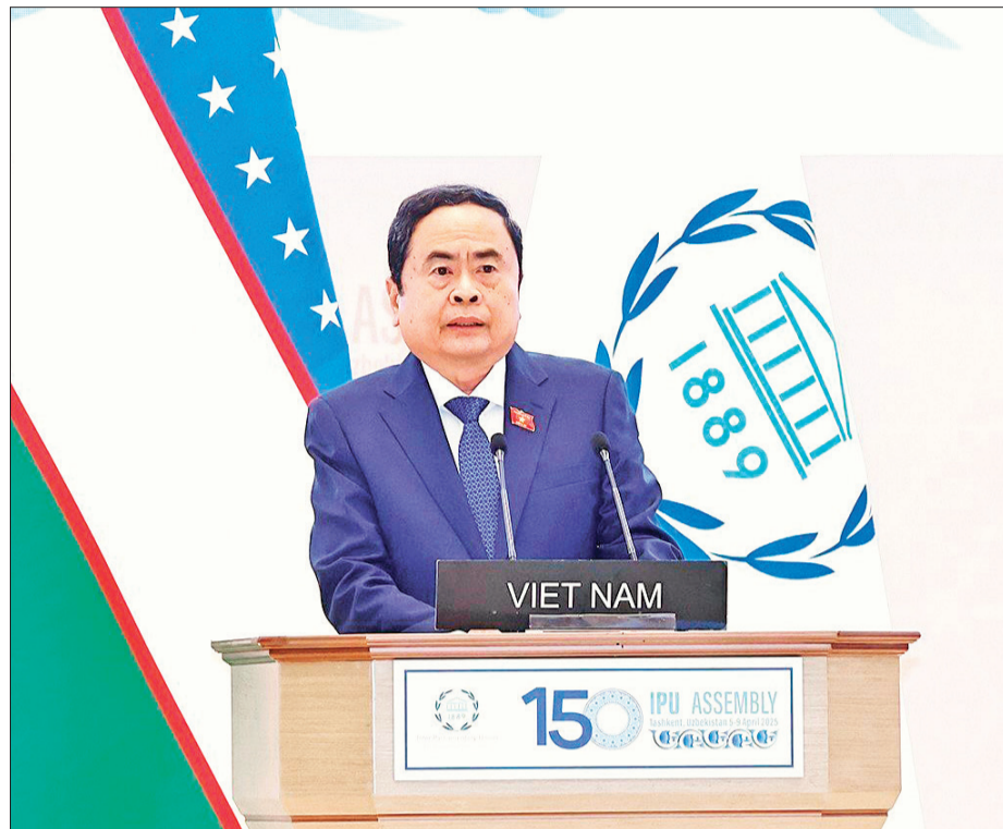
Chủ tịch Quốc hội Trần Thanh Mẫn phát biểu tại phiên thảo luận chung IPU-150.

Sáng 6/4 (giờ địa phương), tại Thủ đô Tashkent, Uzbekistan, Chủ tịch Quốc hội Trần Thanh Mẫn có bài phát biểu quan trọng tại phiên toàn thể cấp cao Đại hội đồng Liên minh Nghị viện Thế giới lần thứ 150 (IPU-150). Là lãnh đạo Quốc hội đầu tiên phát biểu tại phiên họp, Chủ tịch Quốc hội Trần Thanh Mẫn đánh giá cao chủ đề của khóa họp là "Hành động nghị viện vì phát triển và công bằng xã hội" mang ý nghĩa hết sức thiết thực và cấp bách, trong bối cảnh thế giới đang đối mặt những biến động khó lường và nghị viện các nước có vai trò rất quan trọng trong việc hỗ trợ, thúc đẩy phát triển bền vững nhằm giải quyết các thách thức chung.