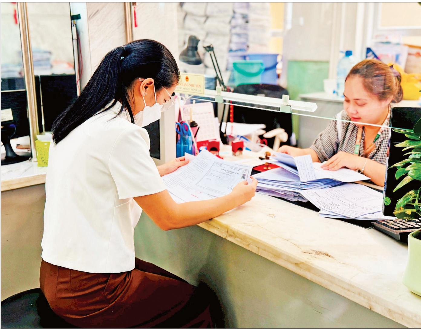
Một biện pháp của thành phố phải phục vụ cho người dân gần 3,2 lần cả nước. Đây là áp lực không nhỏ cho cán bộ, viên chức của thành phố.