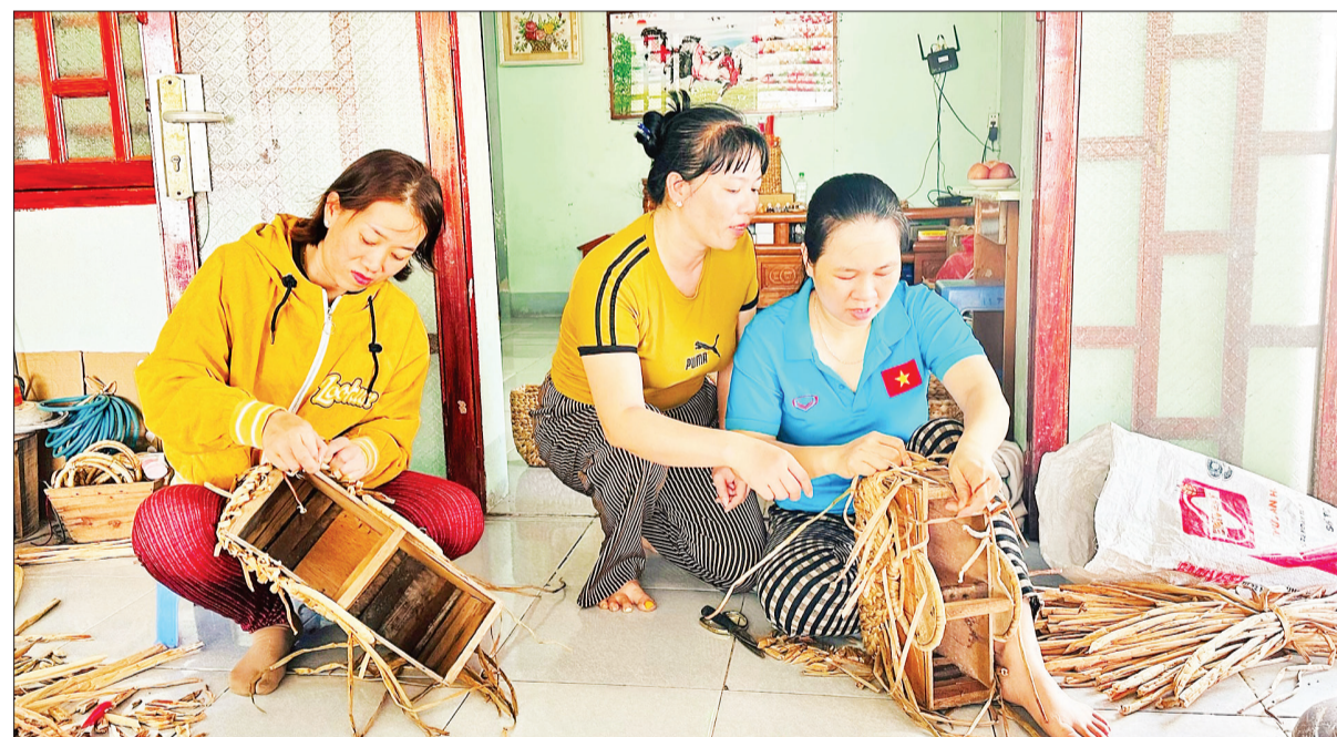
Chị em phụ nữ Tổ hợp tác đan lục bình Hồng Lan-Long Sơn hướng dẫn nhau đan các sản phẩm từ lục bình.

Xu hướng tiêu dùng "xanh" ngày càng hướng đến sự thân thiện với môi trường, sản phẩm từ lục bình trở thành lựa chọn của nhiều người, đặc biệt ở các đô thị phát triển. Không chỉ giúp người dân cải thiện cuộc sống, mà nghề đan lục bình còn góp phần bảo tồn và phát huy nghề truyền thống, đồng thời đáp ứng nhu cầu tiêu dùng bền vững của thị trường trong và ngoài nước.