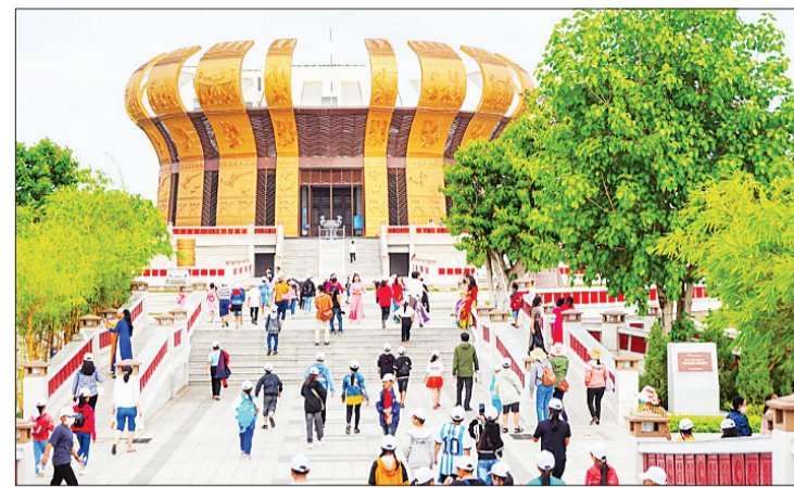
Du khách tham quan Đền thờ Vua Hùng tại thành phố Cần Thơ.