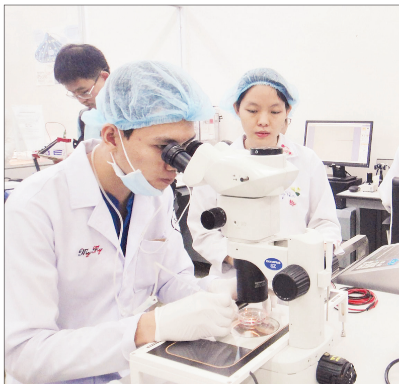
Hoạt động nghiên cứu khoa học tại Đại học Quốc gia Thành phố Hồ Chí Minh.

Một trường đại học thông minh thường dựa trên năm yếu tố cơ bản: Khung viên thông minh; con người thông minh; nghiên cứu thông minh; quản trị thông minh; công nghệ thông