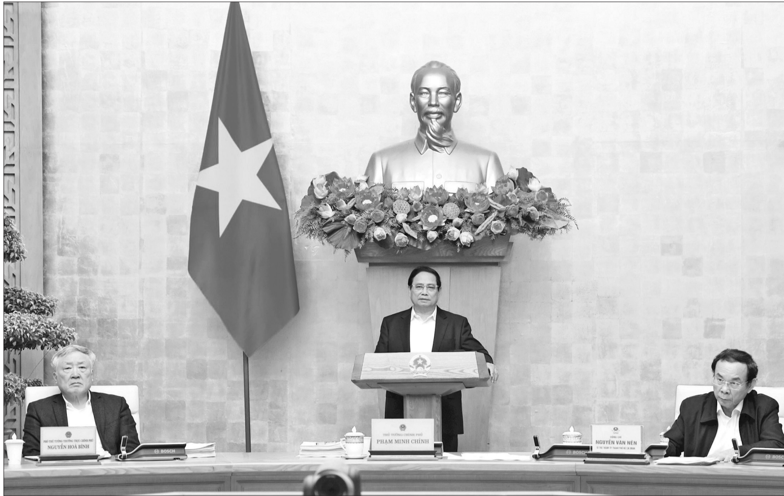
Thủ tướng Phạm Minh Chính chủ trì phiên họp Chính phủ thường kỳ tháng 3 năm 2025.