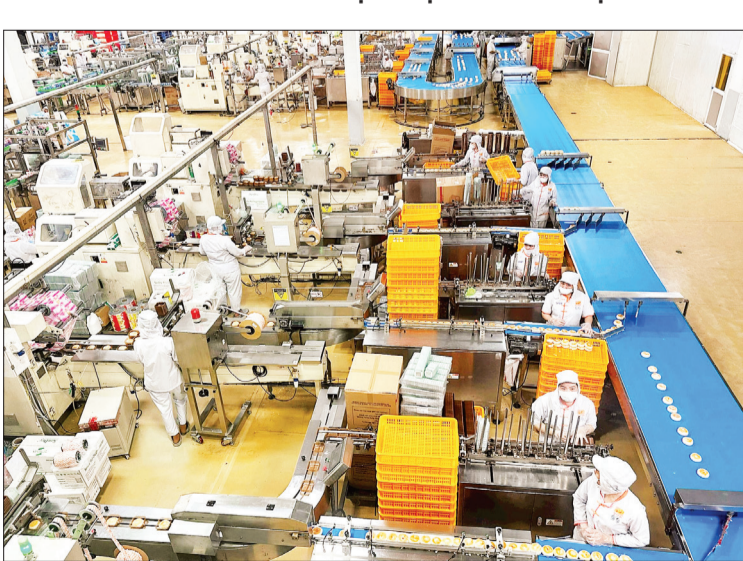
Các khu công nghiệp đang tạo ra việc làm cho hàng nghìn người lao động tại Sóc Trăng.

Theo phương án phát triển cụm công nghiệp thời kỳ 2021-2030, tầm nhìn đến năm 2050 đã được Thủ tướng Chính phủ phê duyệt, trên địa bàn tỉnh Sóc Trăng định hướng phát triển 18 cụm công nghiệp, với diện tích 983,6 ha. Đó là các cụm công nghiệp: Ngã Năm, Khánh Hòa, An Lạc Thôn 1, An Lạc Thôn 2, Lịch Hội Thượng, Xây Đá B, Xây Đá B mới, Thuận Hòa, Long Đức 1, Long Đức 2, Long Đức 3, Thạnh Trị, Vĩnh Phước, Thành phố Sóc Trăng, Long Hưng, Dương Kiếng, Ngọc Đông, Tài Văn. Các cụm công nghiệp đã được phê duyệt quy hoạch sử dụng đất đến năm 2030, đủ điều kiện thu hút nhà đầu tư hạ tầng kỹ thuật. Đến nay, tỉnh đã thành lập được 5 cụm công nghiệp, với diện tích 202,5 ha là các cụm công nghiệp Ngã Năm (44,88 ha), An Lạc Thôn 1 (32,1 ha), An Lạc Thôn 2 (21,62 ha), Xây Đá B (53,9 ha), Xây Đá B mới (50 ha).