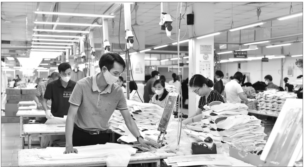
Dây chuyền sản xuất tại Tổng công ty May 10.

Vâng, đó cũng là chiến thắng chung của khát vọng, của ý chí độc lập, tự do của dân tộc Việt Nam! Từ chiến thắng này, nước Việt Nam thống nhất bước vào kỷ nguyên mới hòa bình, xây dựng nước nhà độc lập-tự do-hạnh phúc.