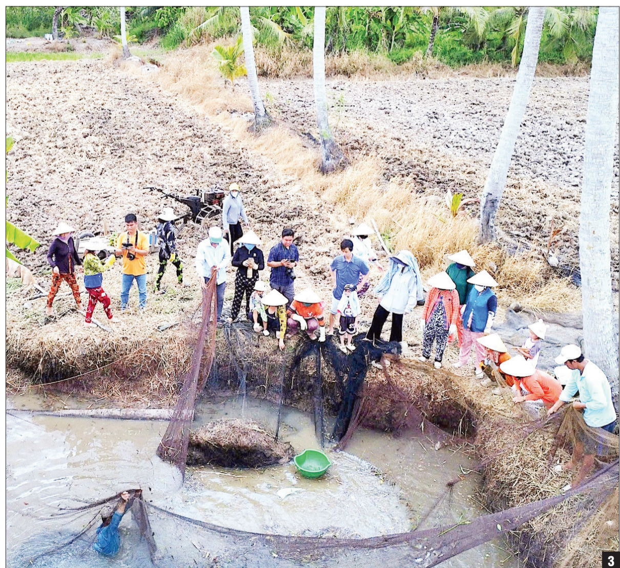
1-Thu hoạch cá đồng bằng hình thức chụp đĩa. 2-Gia chủ lựa cá đồng ngon nướng ngay tại ruộng để thịt dãi chòm xóm đến phụ giúp chụp đĩa. 3-Dùng lưới chụp đĩa ở vùng nông thôn xã Khánh Hải, huyện Trần Văn Thời, tỉnh Cà Mau.