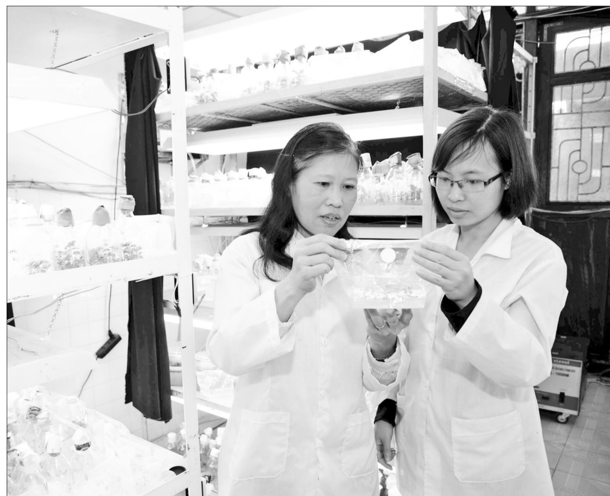
Các kỹ sư Viện Sinh học nông nghiệp (Học viện Nông nghiệp Việt Nam) nghiên cứu giống cây trồng. (Ảnh KHÁNH AN)

Khoa học, công nghệ đóng vai trò quan trọng trong quá trình đột phá phát triển kinh tế-xã hội của đất nước. Tuy nhiên, tại Việt Nam, cơ chế tài chính cho khoa học, công nghệ vẫn còn nhiều bất cập cần được tháo gỡ.