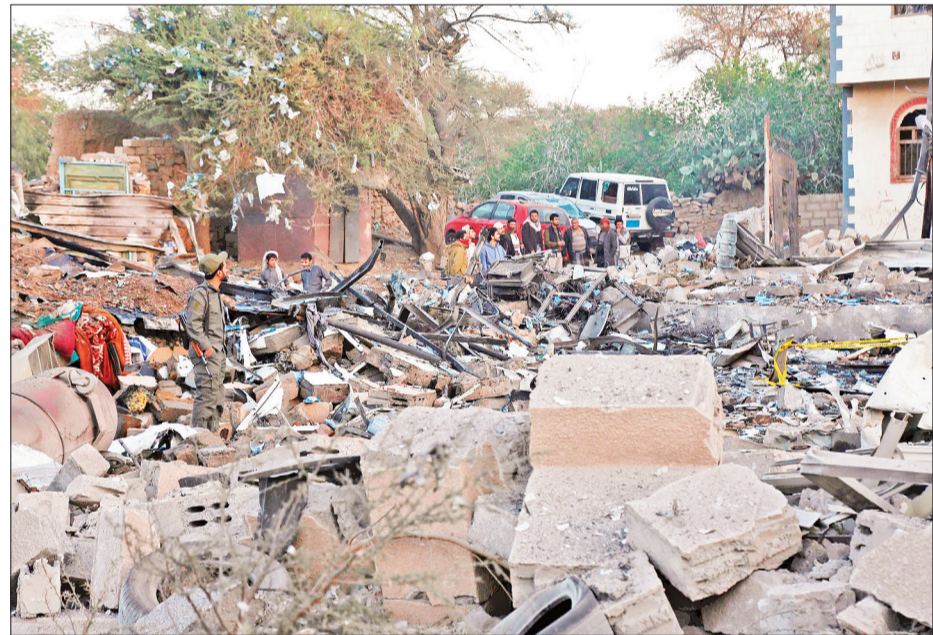
Cảnh đổ nát sau một cuộc không kích của Mỹ nhằm Saana, Yemen. (Ảnh TÂN HOA XÃ)

Nhiều lần bắn tên lửa về phía Israel như một hành động thể hiện sự đoàn kết với người Palestine ở Dải Gaza. Trong khi đó, căng thẳng giữa Houthi và quân đội Mỹ cũng leo thang khi Washington tiến hành các cuộc không kích mới vào Yemen hồi cuối tuần trước.