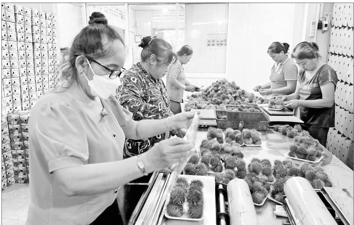
Sơ chế chôm chôm phục vụ xuất khẩu tại Hợp tác xã nông nghiệp Phú Phụng, huyện Chợ Lách (Bến Tre).