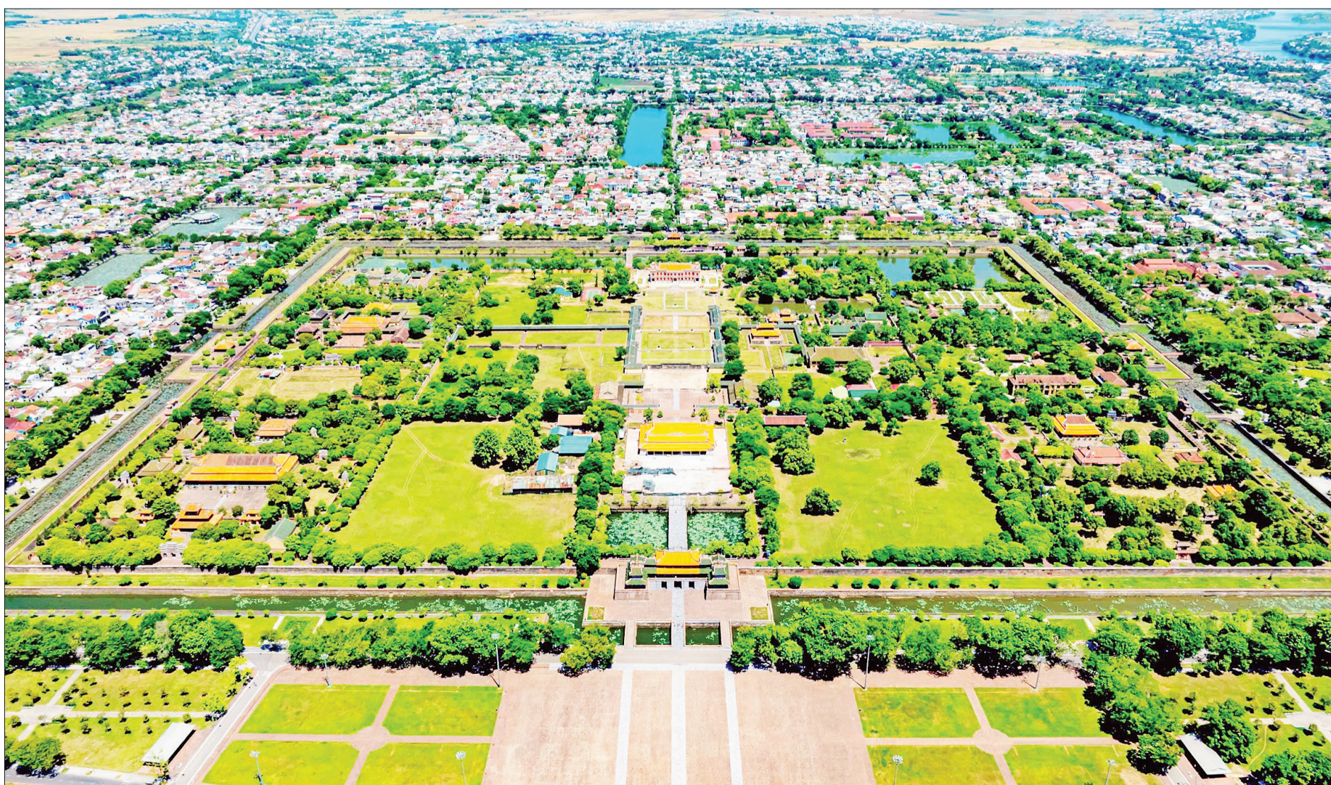
Huế trở thành hình mẫu bảo tồn di sản không chỉ ở Việt Nam mà còn trong khu vực châu Á - Thái Bình Dương.