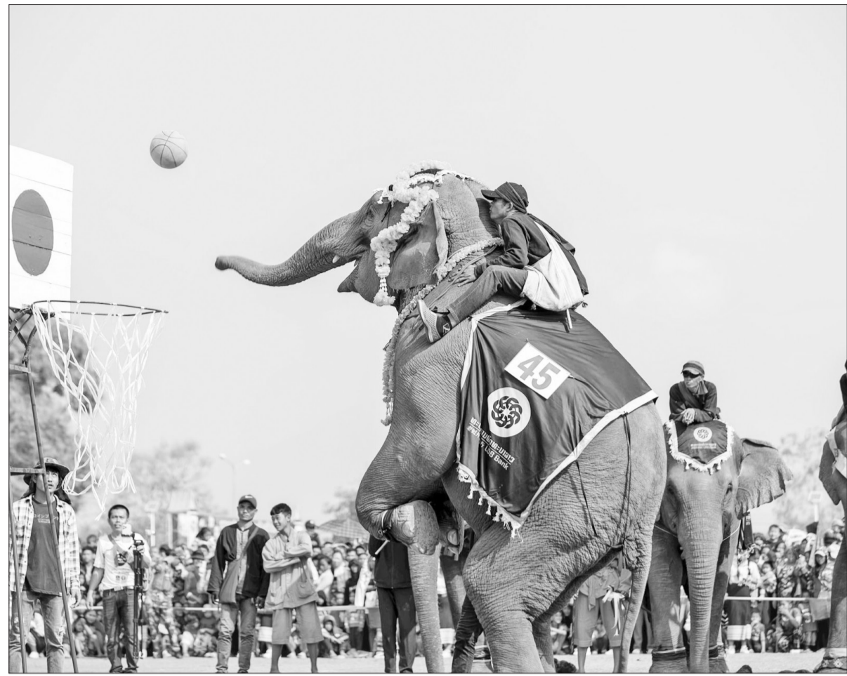
Lễ hội Voi diên ra ở Xayaboury, Lào.

Dưới sự lãnh đạo sáng suốt của Đảng Nhân dân Cách mạng Lào, đất nước Lào đã vượt qua mọi khó khăn, phát huy truyền thống anh hùng, gạt hái nhiều thành tựu to lớn trong công cuộc bảo vệ và xây dựng Tổ quốc. Những bước tiến vững chắc trên con đường phát triển, đổi mới và hội nhập của đất nước Triệu Voi được thể hiện rõ nét qua tình hình chính trị và kinh tế tăng trưởng ổn định, đời sống người dân được cải thiện, vị thế đất nước ngày càng được nâng cao trên trường quốc tế.