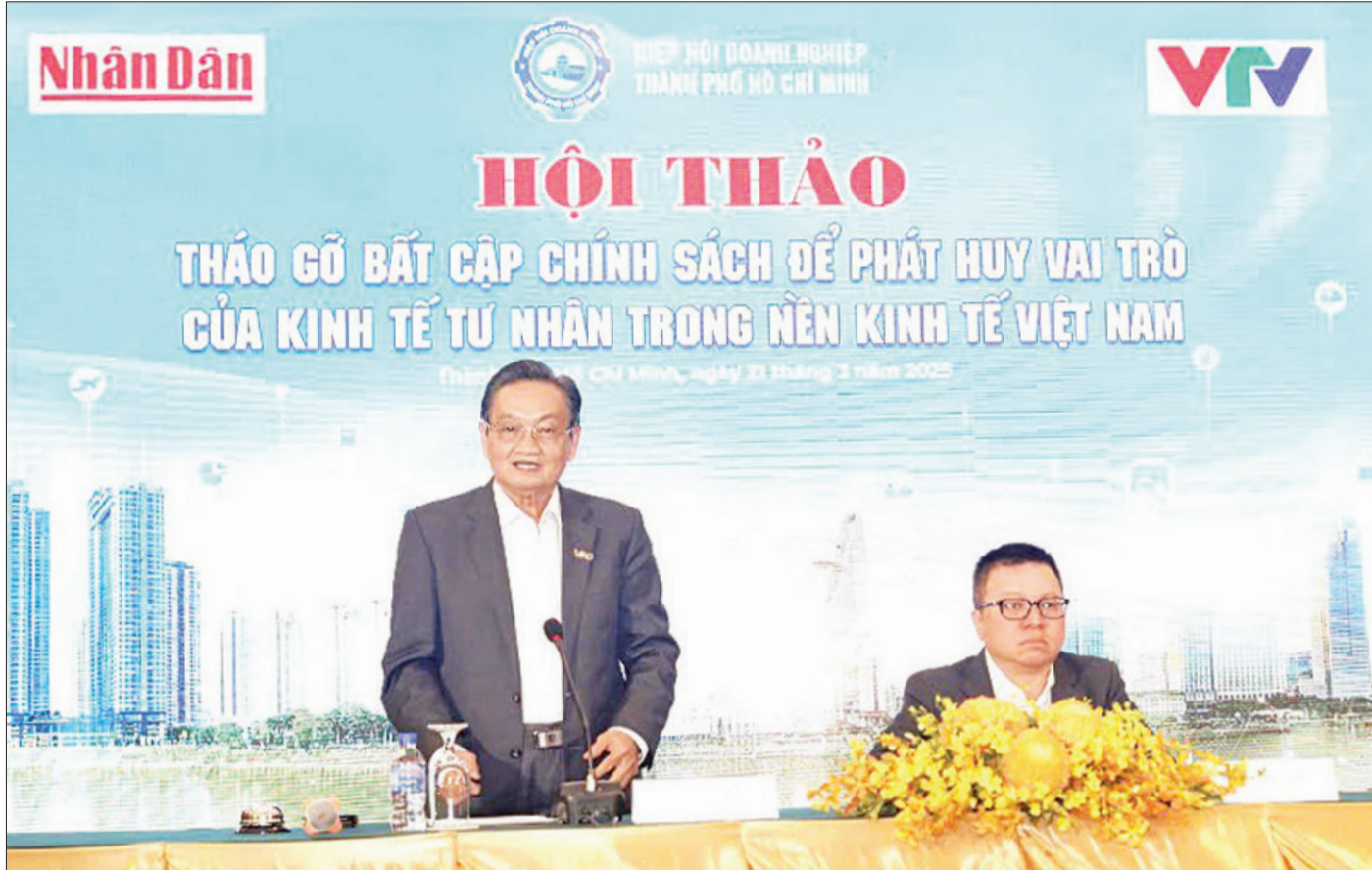
Các đại biểu chủ tọa Hội thảo "Thảo gỡ bắt cấp chính sách để phát huy vai trò của kinh tế tư nhân trong nền kinh tế Việt Nam".