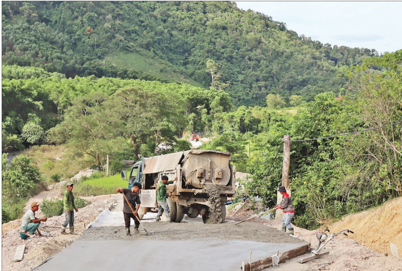
Xây dựng đường giao thông nông thôn ở bản Bung, xã Môn Sơn, huyện Con Cuông, khu vực nằm trong vùng lõi Vườn quốc gia Pù Mát.