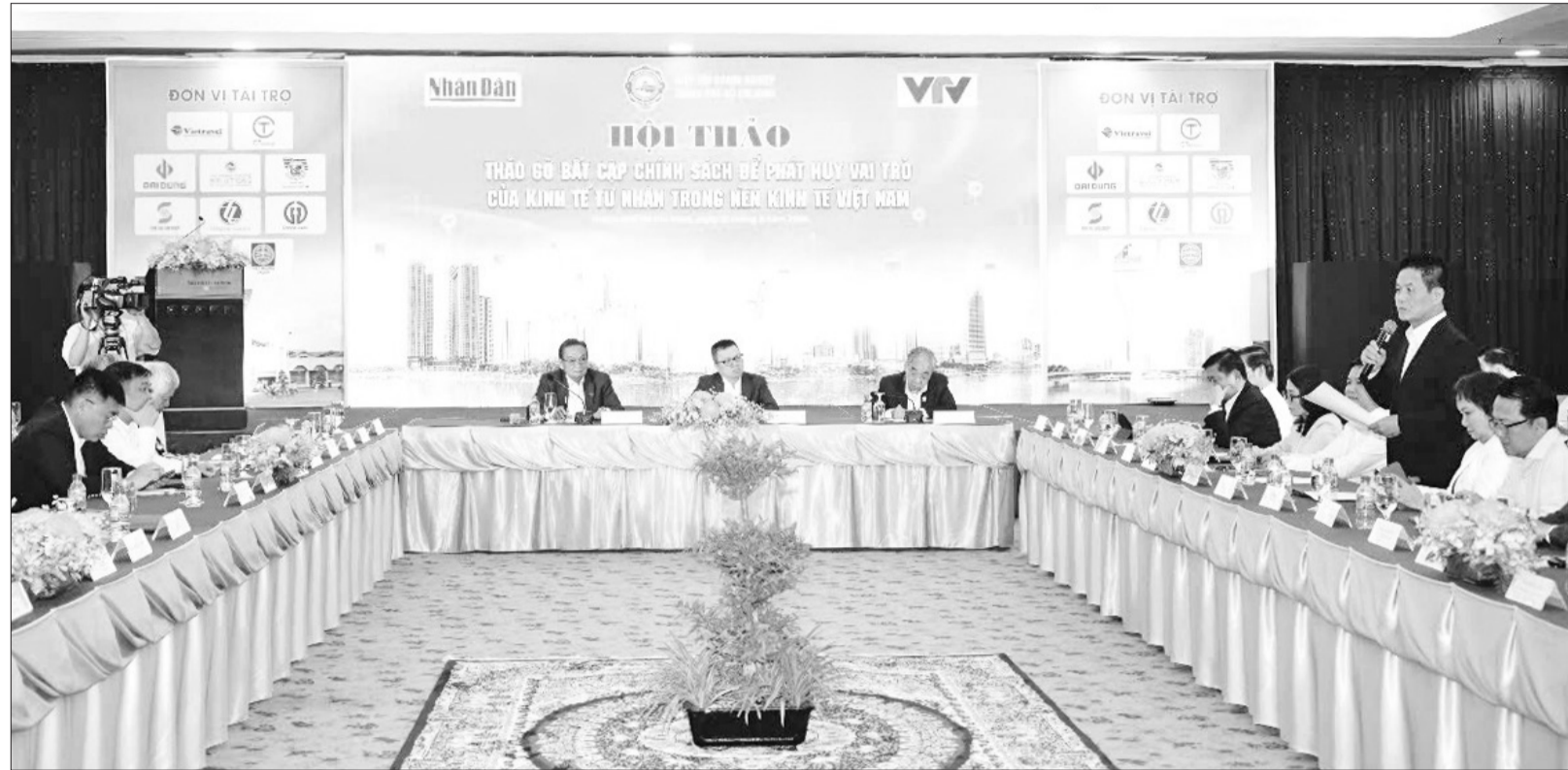
Quang cảnh Hội thảo "Tháo gỡ bất cập chính sách để phát huy vai trò của kinh tế tư nhân trong nền kinh tế Việt Nam".

Nghị quyết của Bộ Chính trị về kinh tế tư nhân sắp được ban hành sẽ định hướng quan điểm và nhận thức trong cả hệ thống chính trị về vai trò của kinh tế tư nhân như là động lực tăng trưởng quan trọng hàng đầu của đất nước. Nghị quyết được kỳ vọng sẽ tạo tinh thần đổi mới, khí thế mới và sự hưng khởi, quyết tâm cao độ không chỉ ở khu vực kinh tế tư nhân mà trong toàn xã hội, đưa nền kinh tế phát triển đột phá, xây dựng nước ta trở thành quốc gia thịnh vượng và phát triển.