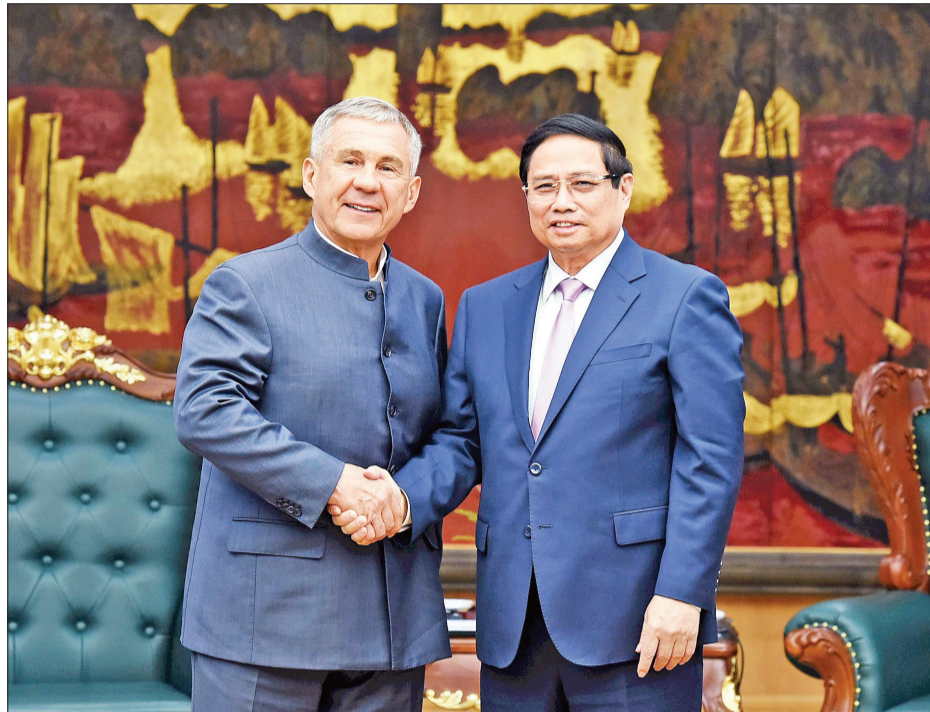
Thủ tướng Phạm Minh Chính tiếp Người đứng đầu Cộng hòa Tatarstan, Liên bang Nga R.N. Minnikhanov.

Chiều 21/3, tại Trụ sở Chính phủ, Thủ tướng Phạm Minh Chính tiếp Người đứng đầu Cộng hòa Tatarstan, Liên bang Nga R.N. Minnikhanov.