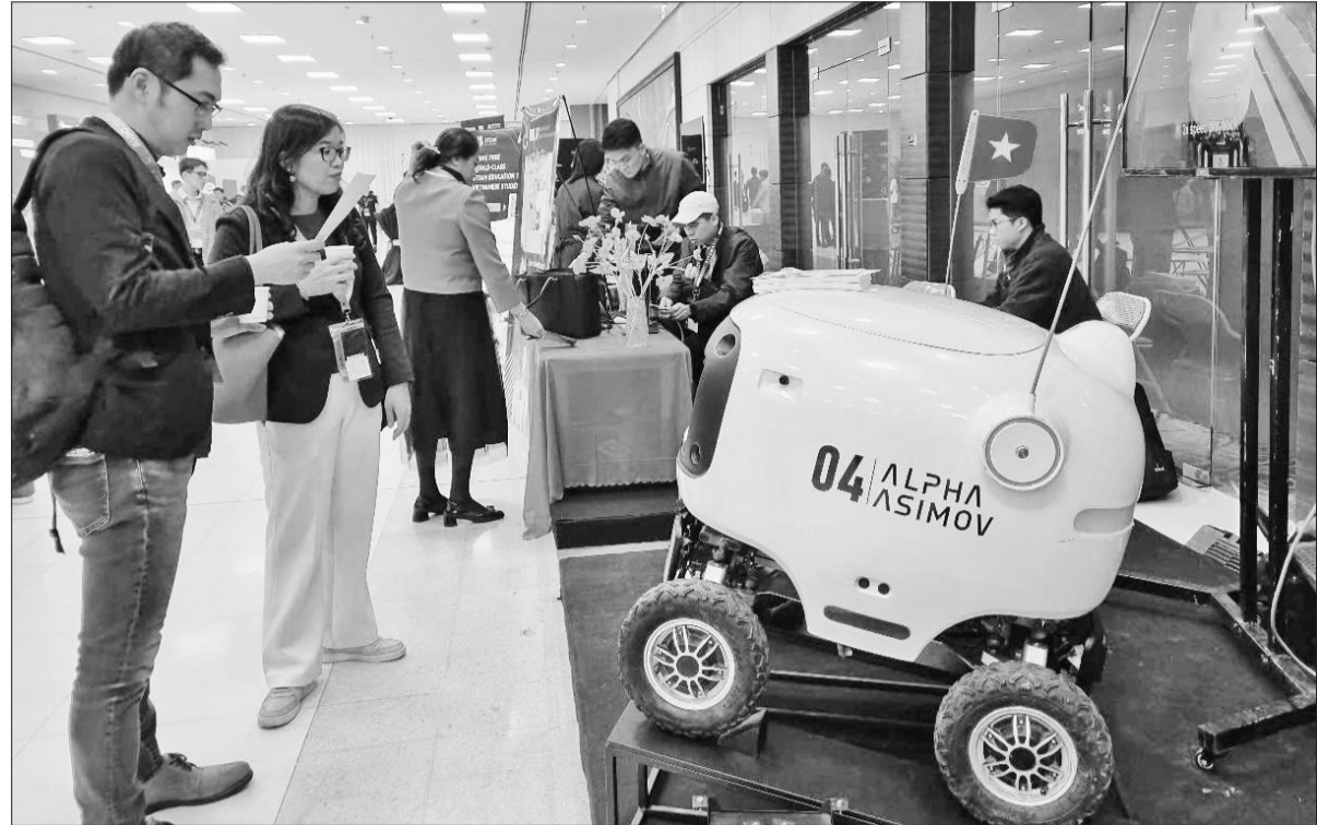
Trình diễn các sản phẩm công nghệ cao tại triển lãm trong khuôn khổ Hội nghị AISC 2025 diễn ra tại Trung tâm Đổi mới sáng tạo quốc gia.

Với vị trí địa lý thuận lợi, nguồn nhân lực trẻ, cơ sở hạ tầng hiện đại và chính sách khuyến khích thu hút đầu tư, Việt Nam đang trở thành một trong những trung tâm công nghệ mới nổi tại Đông Nam Á, thu hút sự quan tâm của các doanh nghiệp hàng đầu thế giới về công nghiệp bán dẫn, trí tuệ nhân tạo (AI).