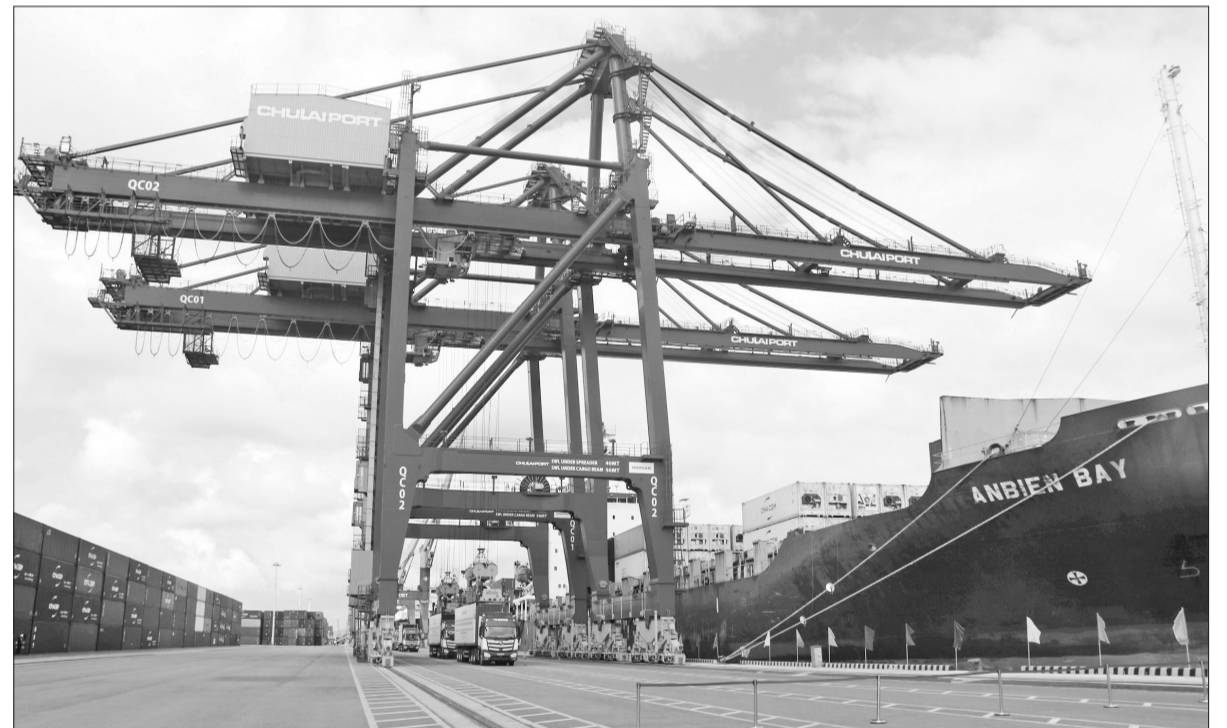
Cảng quốc tế Chu Lai (Quảng Nam) sau đầu tư nâng cấp, có khả năng tiếp nhận tàu trọng tải 50.000 tấn.