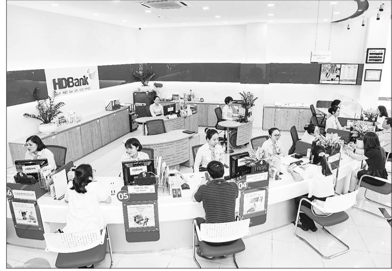
Với eCash, HDBank cung cấp trải nghiệm 100% trực tuyến cho khách hàng, xuyên suốt từ khi quý khách tạo đơn thu hộ cho đến việc quản lý đơn thu và dòng tiền.

Theo báo cáo của Cisco & IDC về mức độ tăng trưởng số của doanh nghiệp nhỏ và vừa tại châu Á-Thái Bình Dương, 62% số doanh nghiệp kỳ vọng chuyển đổi số sẽ giúp họ tạo ra các sản phẩm, dịch vụ mới, từng bước tối ưu hóa chi phí hoạt động, góp phần tăng trưởng kinh doanh.