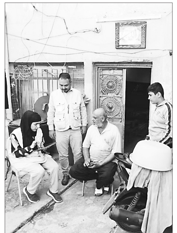
Nhân viên điều tra dân số ở Iraq.

Mặc dù vậy, cuộc tổng điều tra dân số diễn ra trong bối cảnh còn nhiều bất ổn, xung đột sắc tộc vẫn diễn ra ở một số khu vực. Đất nước "ngàn lẻ một đêm" đã trải qua nhiều năm bị tàn phá do chiến tranh, xung đột sắc tộc, khủng bố... Do đó, Bộ Nội vụ Iraq đã phải ban bố lệnh giới nghiêm trên toàn quốc trong thời gian điều tra dân số, hạn chế người dân di chuyển, giảm bớt phương tiện giao thông và tàu hỏa giữa các thành phố, quận, huyện và vùng nông thôn, ngoại trừ trường hợp nhân đạo.