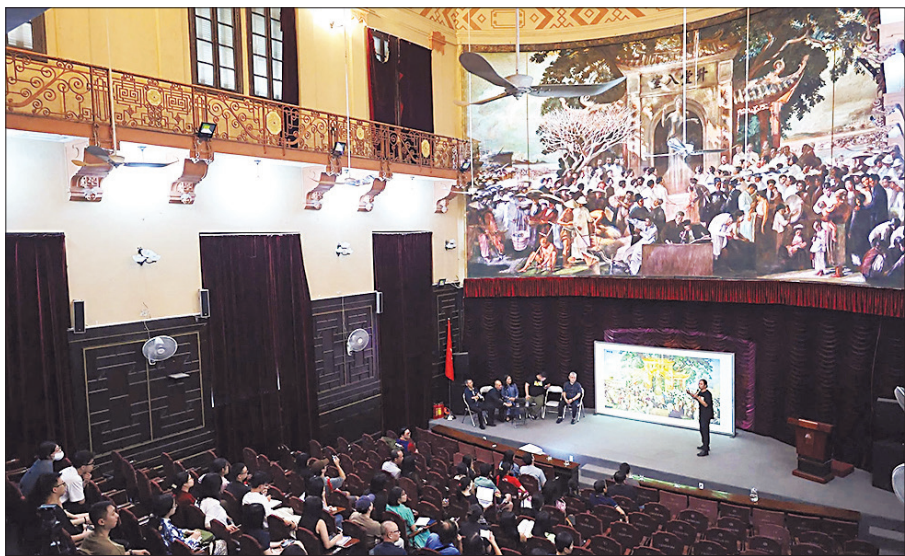
Bức tranh tường của họa sĩ Victor Tardieu trong giảng đường Đại học Tổng hợp Hà Nội.