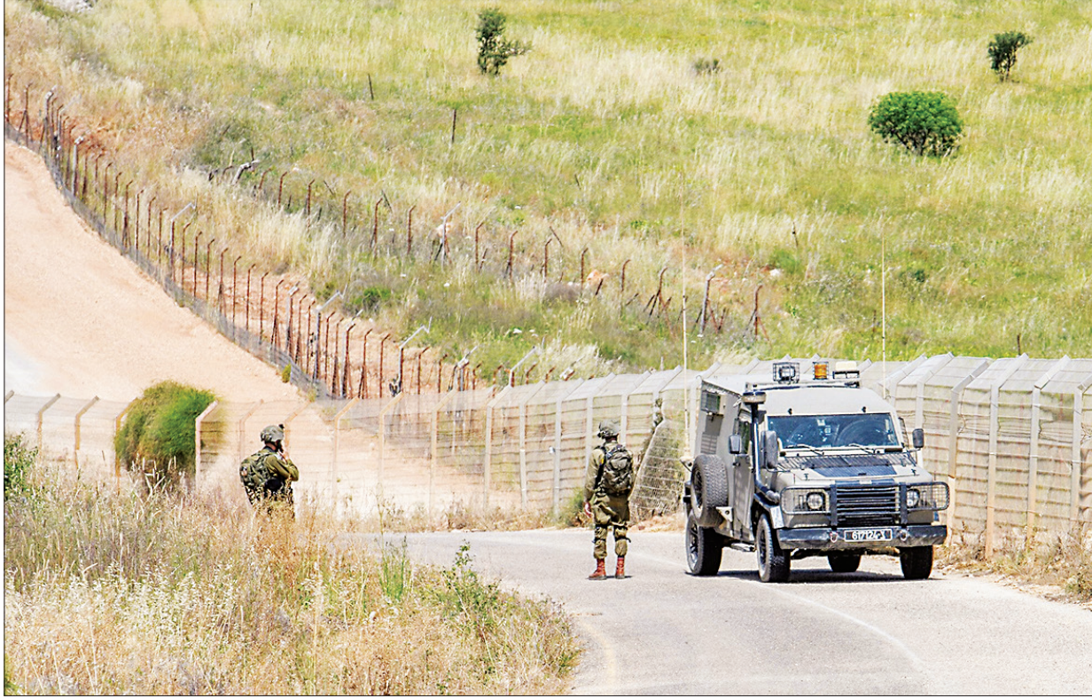
Binh sĩ Israel tại Đường biên giới Xanh với Lebanon.

Thỏa thuận ngừng bắn giữa Israel và phong trào Hezbollah ở Lebanon chính thức có hiệu lực từ sáng 27/11. LHQ và các nước hoan nghênh thỏa thuận là bước tiến quan trọng chấm dứt tình trạng giao tranh gây tổn thất và nỗi thống khổ cho người dân, hướng tới khôi phục hòa bình trong khu vực.