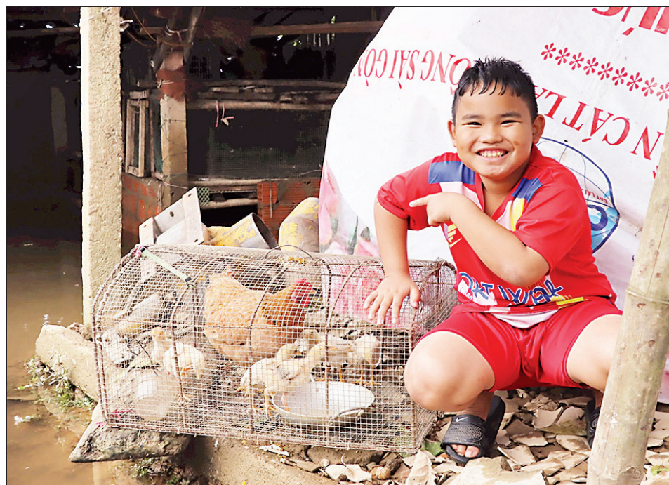
Đàn gà nhỏ vẫn được chăm sóc trong ngày lũ.

Những cao niên giải thích về ý nghĩa từ Càng là do hàng trăm năm trước, các bậc tiền nhân khai hoang