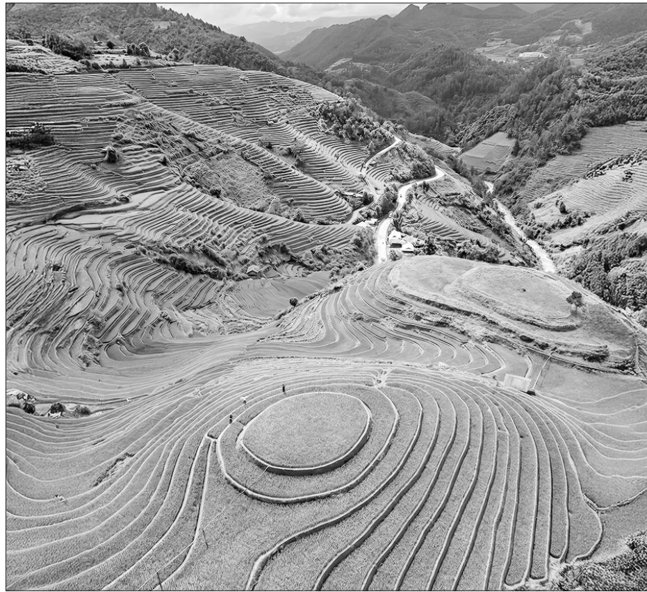
Đồi mâm xôi (xã La Pán Tẩn, Yên Bái) là một trong những địa điểm ưa thích của du khách mỗi khi đến Mù Cang Chải.

Nằm giữa lòng Tây Bắc hùng vĩ, Mù Cang Chải (tỉnh Yên Bái) không chỉ thu hút du khách bởi những thửa ruộng bậc thang đẹp như tranh vẽ, mà còn bởi câu chuyện văn hóa độc đáo của người H'Mông nơi đây. Hành trình phát triển du lịch gắn với bảo tồn là cầu nối giữ gìn, phát huy những giá trị truyền thống lâu đời của đồng bào dân tộc thiểu số, trở thành một biểu tượng của sự hài hòa giữa thiên nhiên và con người.