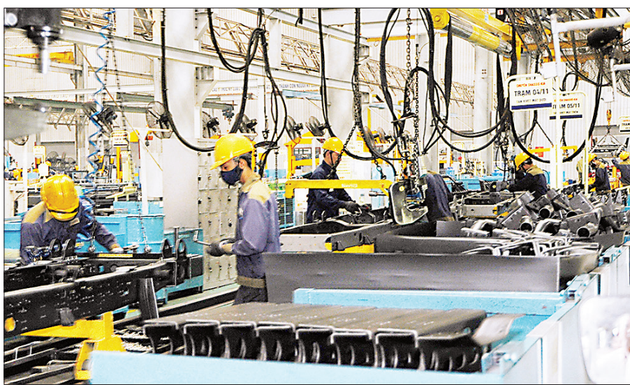
Các doanh nghiệp chú trọng đầu tư trang thiết bị nhằm nâng cao năng lực cạnh tranh.

Năm 2024 chứng kiến sự phục hồi của nền kinh tế qua con số đăng ký mới tăng trưởng hơn 10%. Những doanh nghiệp trong bảng