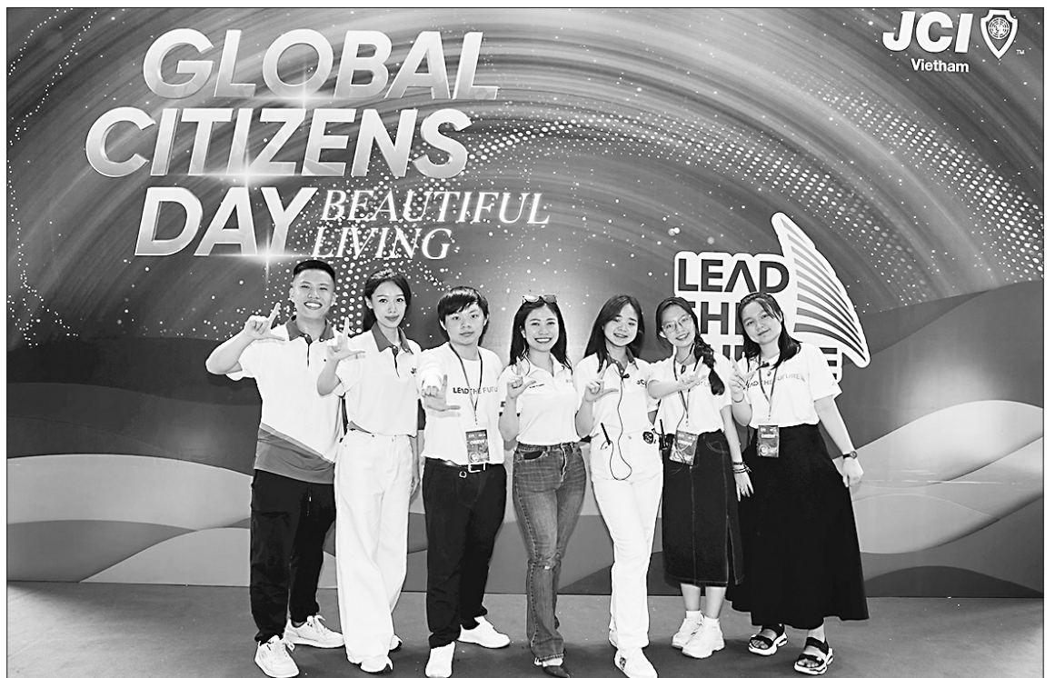
Các bạn trẻ thu nhận được nhiều thông tin bổ ích từ sự kiện.

Tại Ngày hội Công dân toàn cầu năm 2024 vừa được tổ chức tại Thành phố Hồ Chí Minh, một số lãnh đạo nhiều doanh nghiệp, tổ chức đã chia sẻ về khái niệm “Công dân toàn cầu” và cung cấp giải pháp, tiếp thêm động lực để bạn trẻ chủ động chuẩn bị hành trang hội nhập.