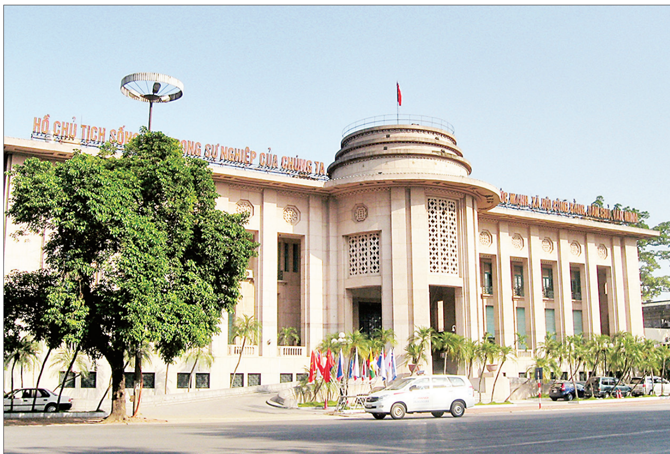
Trụ sở Ngân hàng Nhà nước Việt Nam tại Hà Nội.

Thủ đô Hà Nội được đánh giá là có lợi thế về chính sách và quyết định điều hành kinh tế vĩ mô. Các cơ quan quản lý nhà nước về tài chính, ngân hàng đều đặt trụ sở chính tại đây, tạo điều kiện thuận lợi cho việc xây dựng và triển khai các chính sách tài chính.