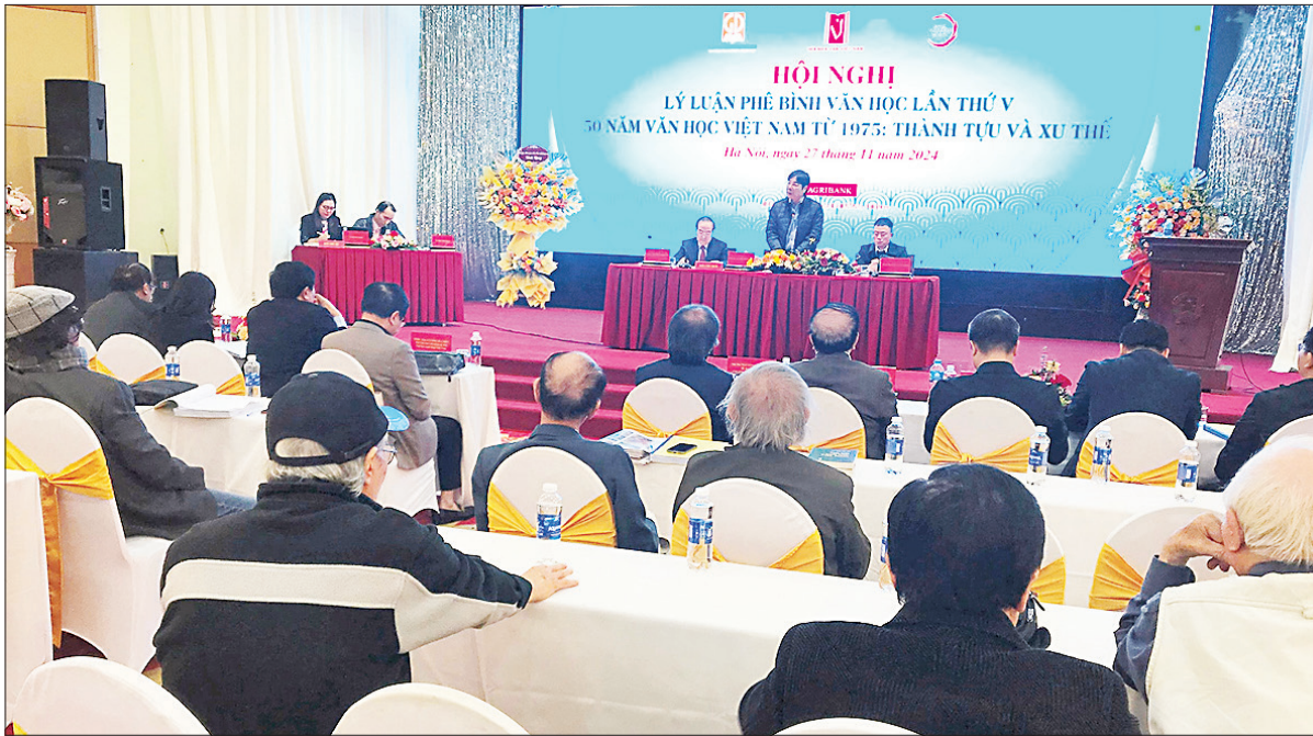
Quang cảnh hội nghị.

Hoạt động lý luận phê bình văn học nước nhà từ năm 1975 đã được nhìn lại khái quát ở lực lượng, thành quả, hiệu quả đóng góp, xu hướng, ước vọng phát triển. Có những điểm nhấn quan trọng của quá trình này liên quan đến đường lối, chính sách, quan niệm, trường phái. Tuy nhiên, cần nhiều hơn những hiến kế cụ thể cho bộ phận của hoạt động lý luận phê bình trong tương lai.