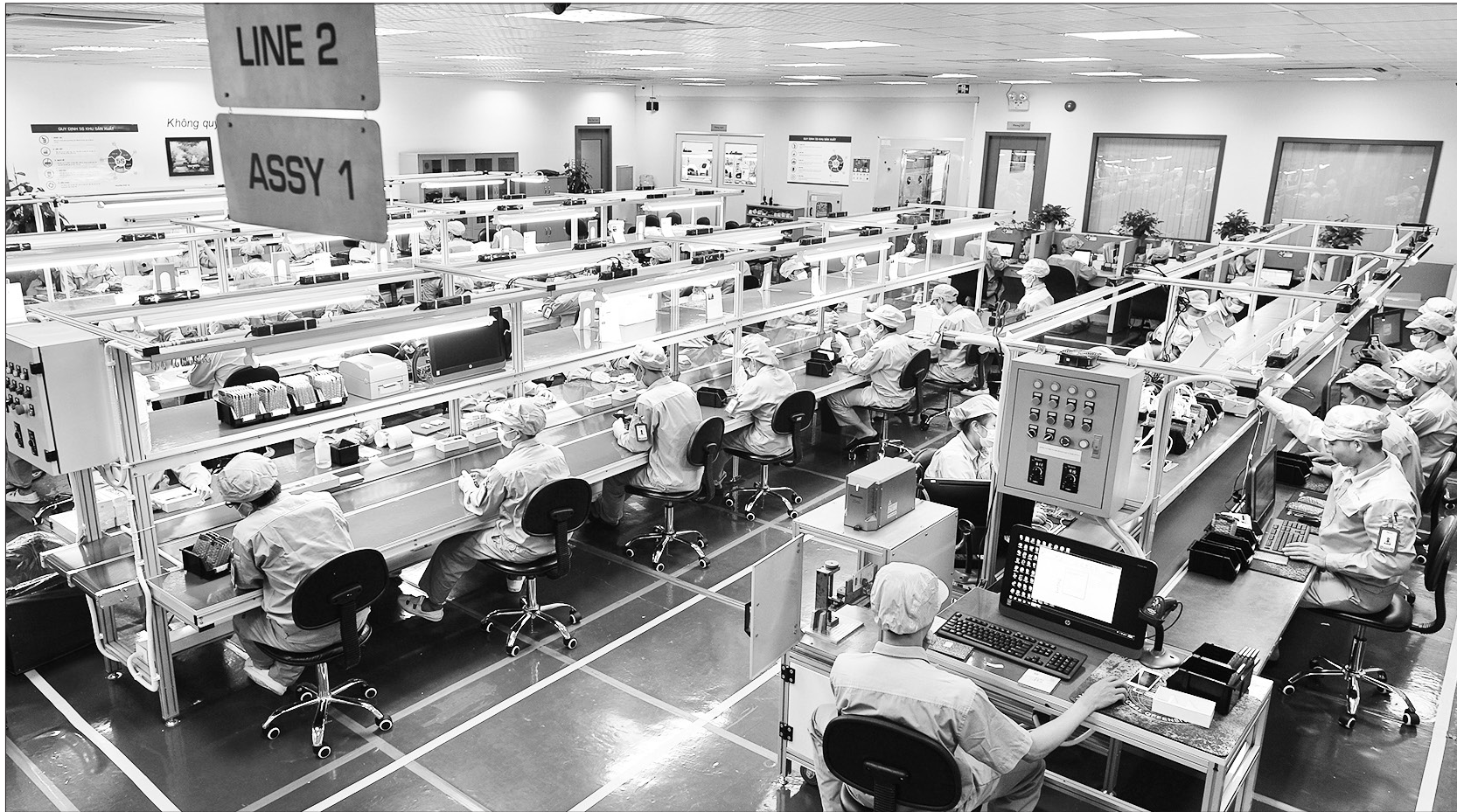
Nguồn vốn đầu tư nước ngoài của Việt Nam được dự báo tăng lên đáng kể trong năm 2025.

Tại Kỳ họp thứ 8, Quốc hội khóa XV, với gần 89% số phiếu đại biểu tán thành, Quốc hội đã chính thức thông qua Nghị quyết về Kế hoạch phát triển kinh tế - xã hội năm 2025. Theo Nghị quyết, có 15 chỉ tiêu chủ yếu đã được Quốc hội quyết nghị, trong đó tốc độ tăng tổng sản phẩm trong nước (GDP) khoảng 6,5 - 7% và phần đầu khoảng 7 - 7,5%.