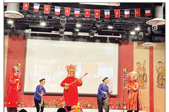
Biểu diễn then tại Pháp.