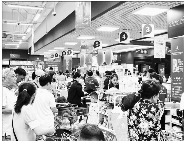
Doanh nghiệp thực phẩm, các chuỗi siêu thị tại TP Hồ Chí Minh và Bình Dương đã sẵn sàng hàng hóa phục vụ dịp Tết 2025.