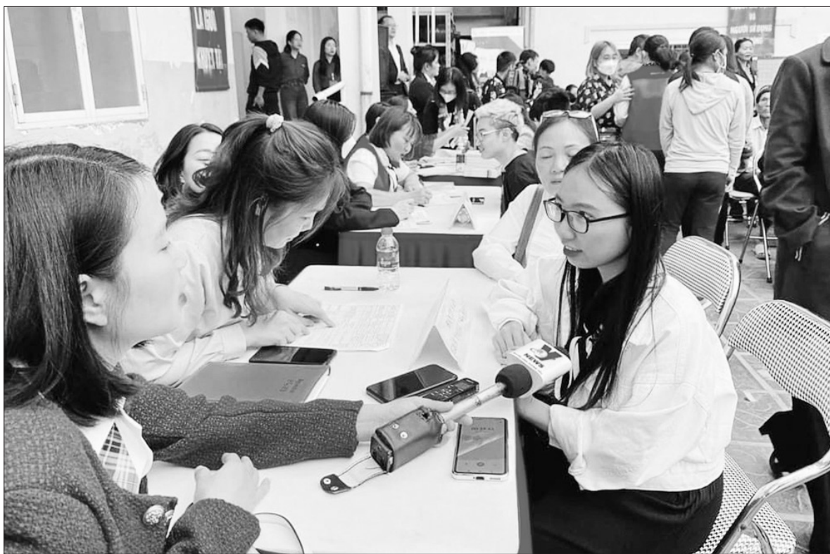
Phiên giao dịch việc làm thu hút nhiều lao động trẻ tham gia.

Sáng 27/11, Quốc hội thảo luận tại hội trường về dự án Luật Việc làm (sửa đổi), một trong những điểm đáng chú ý là đề xuất tăng mức trợ cấp thất nghiệp lên 75%.