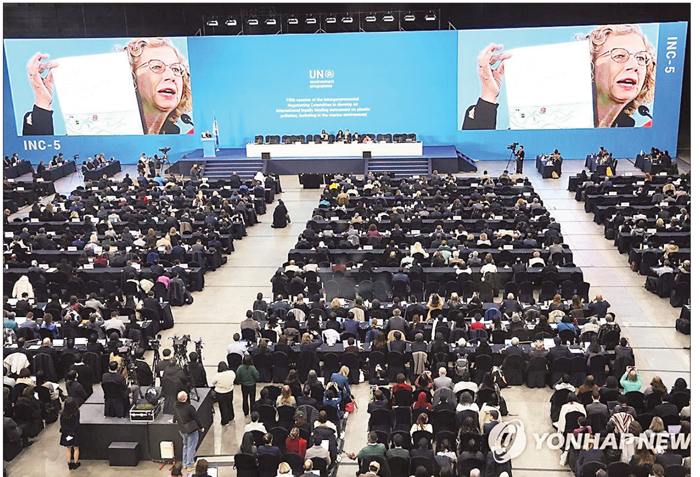
Quang cảnh vòng đàm phán thứ 5 về chống ô nhiễm nhựa tại Hàn Quốc.