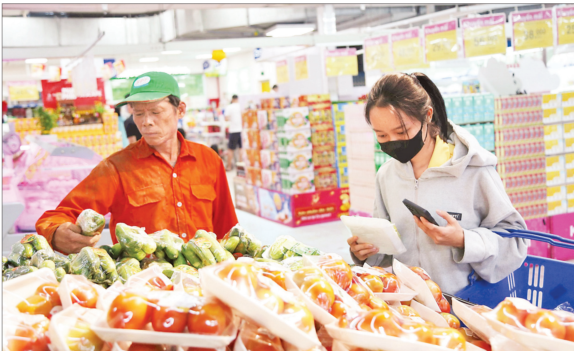
Co.opmart tiếp tục chương trình "Đi chợ đồng giá".