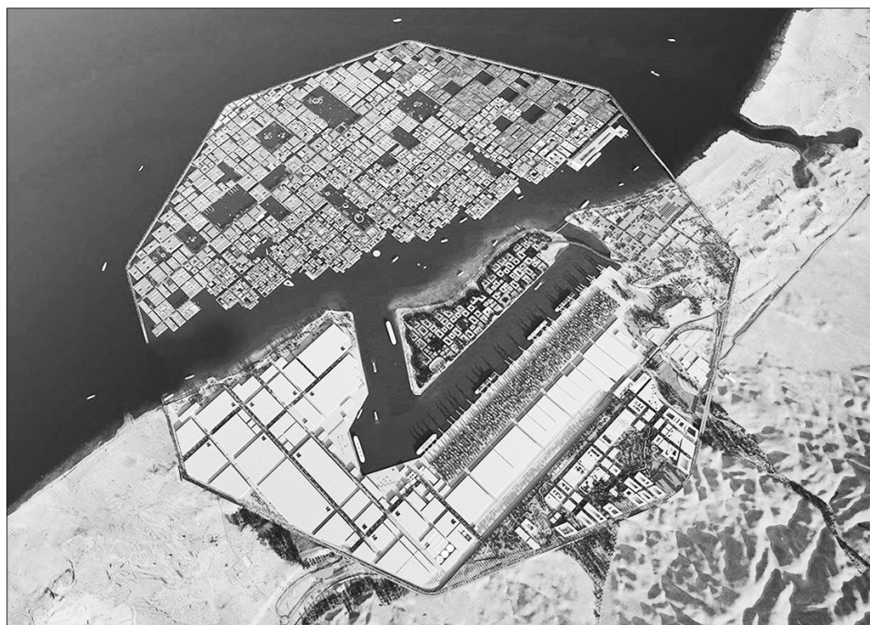
Thành phố cảng nổi Oxagon đang trong thời gian thi công.