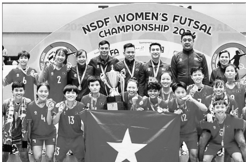
Đội tuyển futsal nữ Việt Nam vô địch bóng đá trong nhà khu vực Đông Nam Á.

Chủ nhân chiếc cúp vô địch bóng đá trong nhà (futsal) khu vực Đông Nam Á đã được xướng lên với cái tên hoàn toàn mới: Đội tuyển futsal nữ Việt Nam. Đánh bại Thailand trong trận chung kết là một giấc mơ có thật với các cô gái Việt Nam bởi để tới được đích vinh quang ấy, futsal nữ Việt Nam phải mất hơn 10 năm chờ đợi.