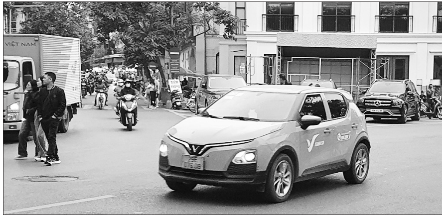
Taxi điện đang phổ biến hơn trong đời sống.

Sau gần 2 năm kể từ thời điểm hãng taxi điện đầu tiên ra mắt thị trường, Việt Nam hiện đã có hơn 20 nghìn xe taxi điện, chiếm 30% thị phần. Nhiều hãng taxi truyền thống cũng đang lên kế hoạch điện hóa phương tiện. Tuy nhiên, bài toán xanh hóa lĩnh vực vận tải vẫn đối mặt nhiều thách thức!