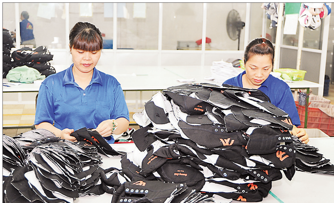
Kinh tế Việt Nam đang tiếp tục duy trì đà tăng trưởng cao.