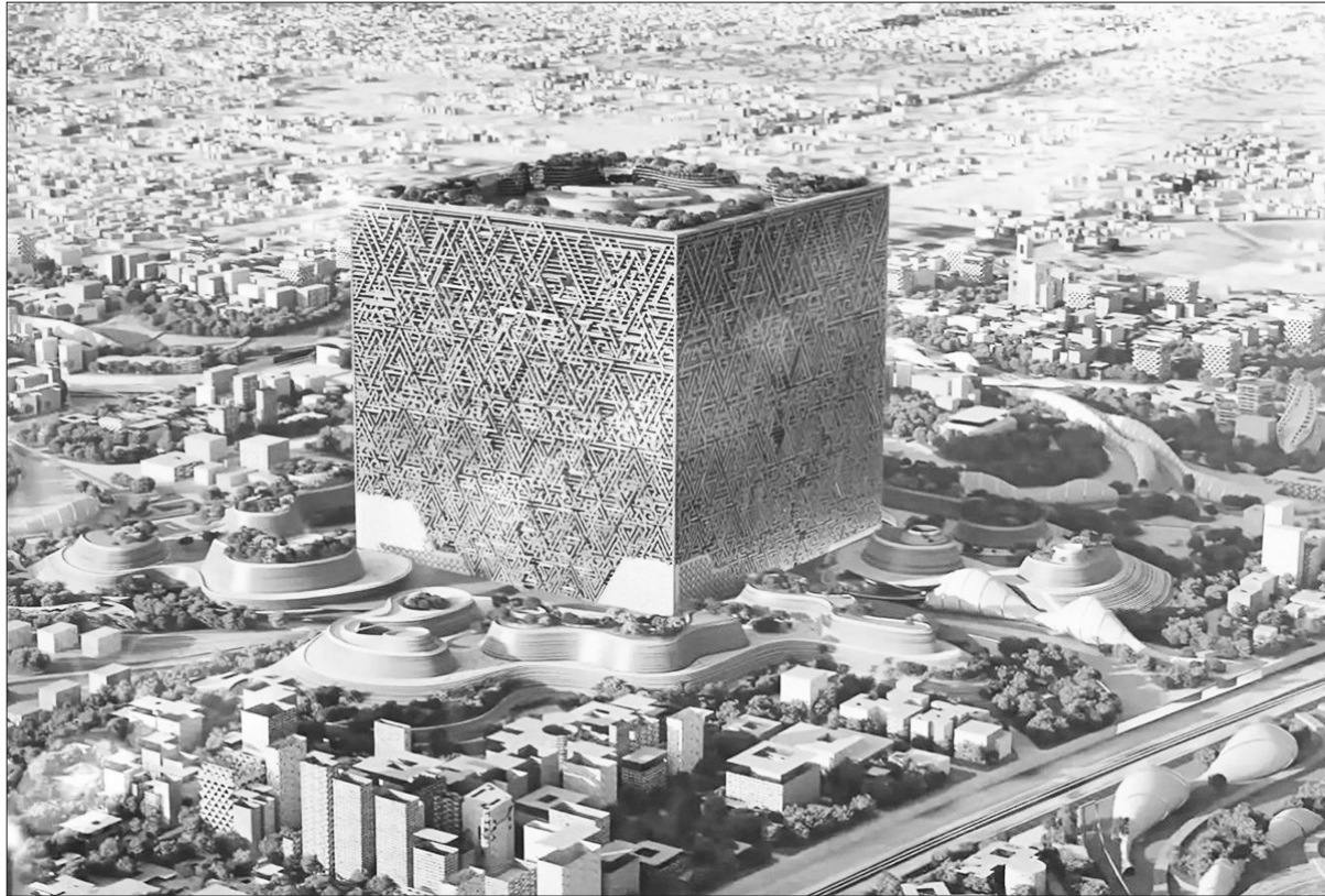
Bản vẽ mô phỏng tòa nhà Mukaab ở Riyadh.

Ngành xây dựng được dự báo sắp trải qua một cuộc chuyển đổi quan trọng khi ngày càng nhiều công cụ kỹ thuật số, tự động hóa, trí tuệ nhân tạo (AI)... đang đóng góp vào xu hướng xây dựng những công trình tương lai.