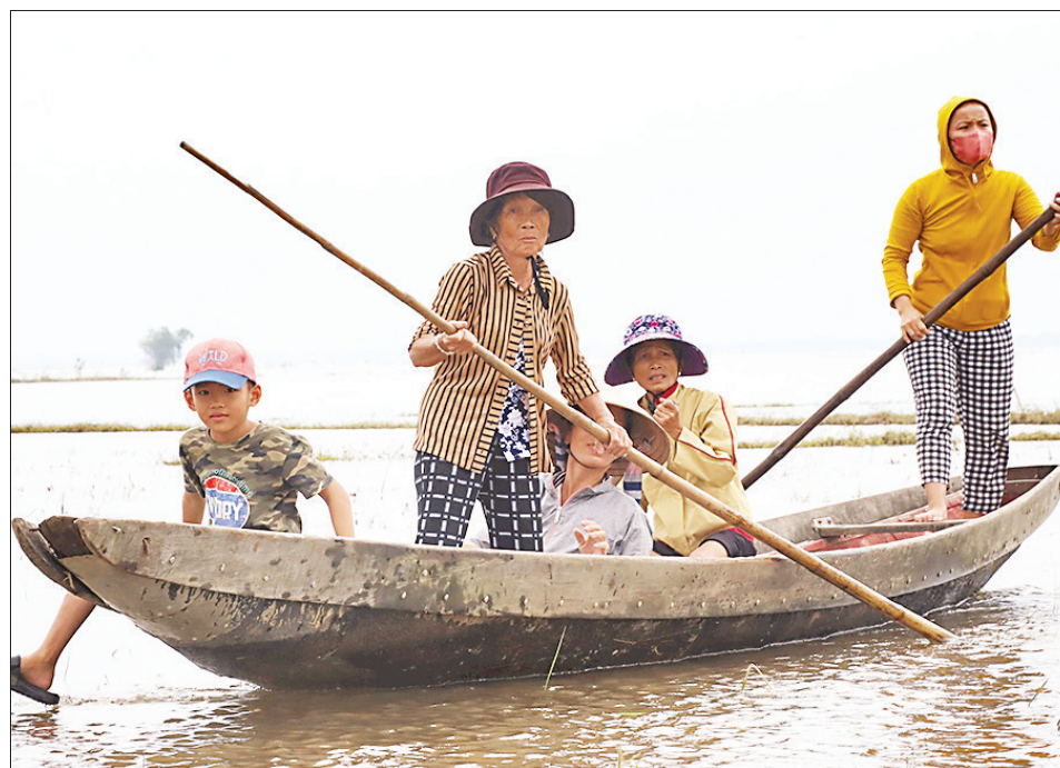
Mùa lụt, người dân vùng Càng chèo thuyền ngay trên mảnh ruộng thường canh tác lúa.

mảnh đất đôi bờ hạ nguồn dòng sông Ô Giang. Người dân đến từ 5 xã (nay là 4 xã: Hải Phong, Hải Chánh, Hải Thành, Hải Thọ) lập thành 7 xóm nhà để quần cư và làm nông. Các xóm nhà như những chiếc càng giữ ranh giới làng xã nên được gọi là Càng. Sống ở Càng người dân quen với tình cảnh lụt lội mỗi năm kéo dài 3 tháng ròng rã. Việc chăn nuôi gia cầm vì thế cũng nương theo thời tiết, mùa mưa hầu như không nhà nào chăn nuôi, tháng hoặc để có gà, vịt đón Tết hoặc gầy chút con giống cho mùa sau, bà con nuôi vài con trong những chiếc lồng để để bê đi chuyển theo mặt con nước lớn, ròng. Mỗi năm người dân canh tác hai vụ lúa, lúa gặt xong được bán ngay trên đồng ruộng, chỉ chờ phần lại đủ ăn cho cả gia đình đợi mùa thu hoạch kế tiếp.