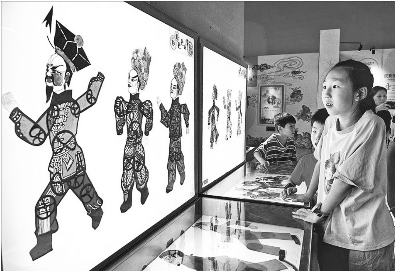
Trẻ em thích thú xem trình diễn nghệ thuật bằng công nghệ kỹ thuật số.