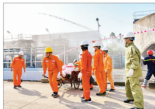
Các lực lượng tham gia diễn tập.