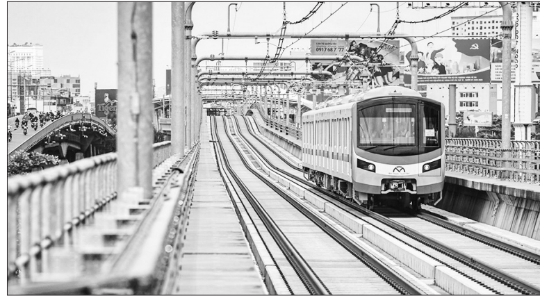
Tuyến metro số 1 có chiều dài gần 20 km, dự kiến đưa vào khai thác từ tháng 12 tới.

Tuyến metro số 1 (Bến Thành - Suối Tiên) đã hoàn tất giai đoạn chạy thử, vận hành thử nghiệm từ 20-100% công suất và dự kiến vận hành chính thức vào ngày 22/12 tới. Mới đây UBND Thành phố Hồ Chí Minh vừa ban hành giá vé dịch vụ vận tải tuyến metro số 1 và đề xuất miễn vé cho 5 đối tượng.