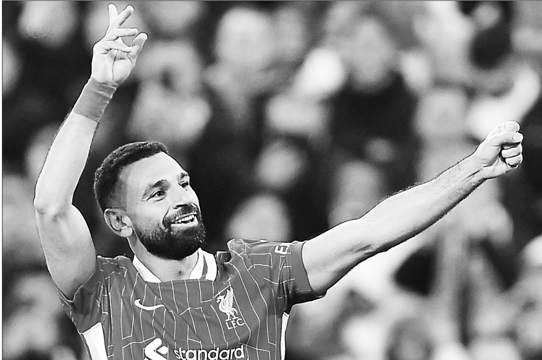
Salah là cầu thủ có thu nhập cao nhất của Liverpool hiện tại với 350 nghìn bảng mỗi tuần.

Mohamed Salah vừa gây nên “trận động đất” ở sân Anfield, sau những tuyên bố về khả năng anh sẽ chia tay Liverpool vào cuối mùa giải.