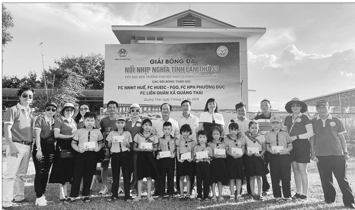
Ban tổ chức trao quà tặng cho các em học sinh xã Quảng Thái (huyện Quảng Điền).

Năm 2024 đánh dấu 10 năm trái bóng nghĩa tình lần trên sân bóng của tất cả huyện, thị xã, thành phố ở tỉnh Thừa Thiên Huế. 33 giải bóng đá thiện nguyện được tổ chức đã trao đi bao nghĩa tình, lan tỏa hơi ấm, tiếp thêm động lực để hàng trăm học sinh, sinh viên có hoàn cảnh khó khăn bước chân đến trường.